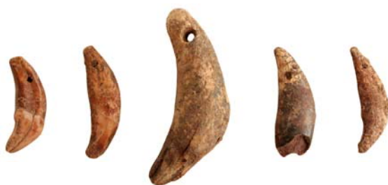
Рис. 5. Подвеска из просверленных клыков хищников (с увеличением)