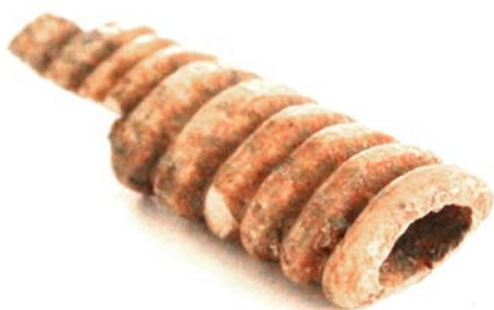
Рис. 3. Накосное украшение (с увеличением)