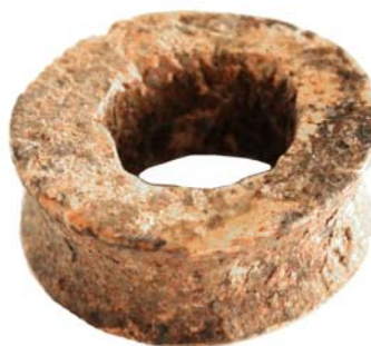
Рис. 7. Украшение из кости (с увеличением)

В каменном ящике в южной части раскопа I, в могильной яме I, обнаружен клык