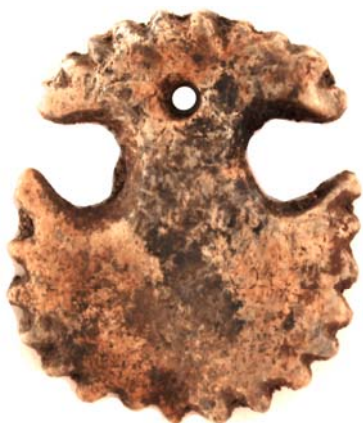
Рис. 6. Украшение, выполненное в виде казахской «айсырға» (серьга в форме луны) (с увеличением)

ны, имеется крестообразный выступ размером 5 мм, в центре присутствует отверстие диаметром 1,1 см.