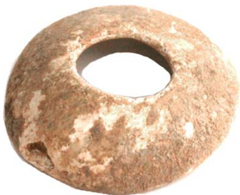
Рис. 4. Подвеска из раковины (с увеличением)