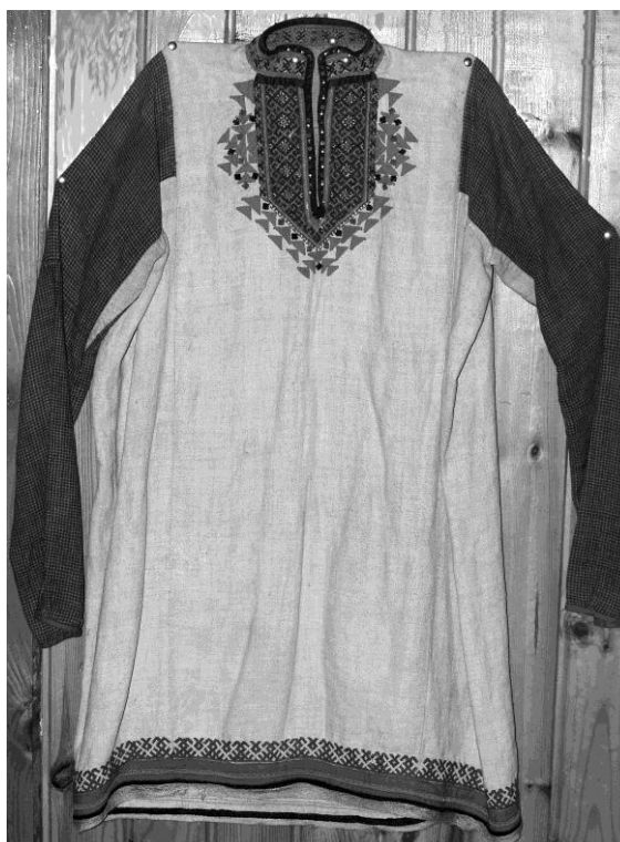
Рис. 4 (фото). Та же рубаха: общий вид