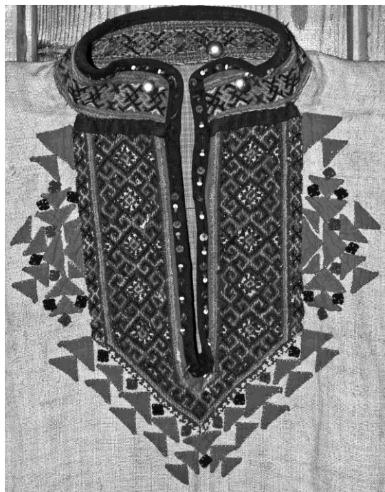
Рис. 3 (фото). Рубаха из с. Юва: нагрудная вышивка (фото Е. Е. Никоноровой, 2006 г.)

Ювинская рубаха наглядно демонстрирует не только своеобразие декора одежды красноуфимских удмуртов, но и проявления