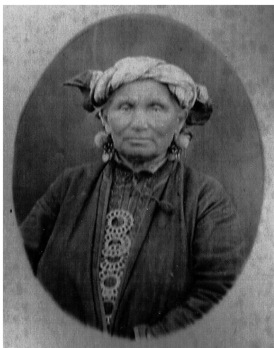
Рис. 1 (фото). Удмуртка Красноуфимского уезда Пермской губернии: на голове – полотенчатый убор; в ушах – серьги с пушками; на рубашке видна нашивка, идущая от края нагрудной вышивки широким углом вверх; разрез застегнут круглыми фибулами (из архива Этнографического музея Казанского государственного университета, № ЭМУ/И–Ф–VIб–196)