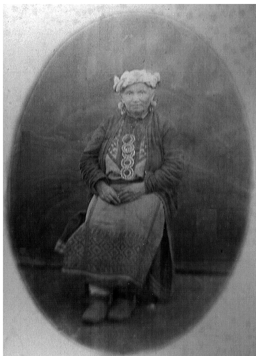
Рис. 2 (фото). Та же удмуртка в полный рост (№ ЭМУ/И–Ф–VIб–202)

костном красноуфимской удмуртки фартук и кафтан из темного полотна. Фартук по подолу украшен широкой полосой тканого орнамента, соединительные швы центрального полотнища закрыты нашитыми полосками (рис. 1, 2).