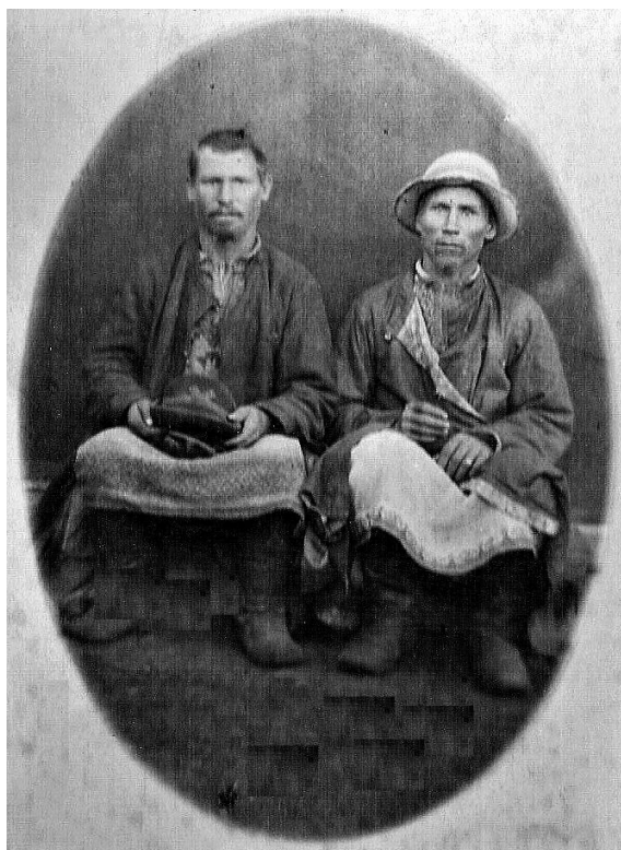
Рис. 6 (фото). Удмурты Красноуфимского уезда Пермской губернии (№ ЭМУ/И-Ф-VI6-202)

удмуртско-марийского взаимодействия в этой сфере. Как мы уже отмечали, много общего (в материале, технике и орнаменте) с марийскими традициями имеет ее нагрудная вышивка. Тканый орнамент на подоле ювинской рубахи полностью совпадает с подольным тканым узором марийских рубах. Как и все марийские рубахи из белого холста, описанная удмуртская имеет рукава из сине-белой мелкоклетчатой пестряди.