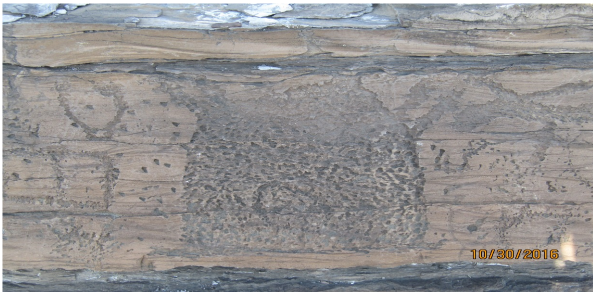
Рис. 1 (фото). Юртообразное жилище (без масштаба)