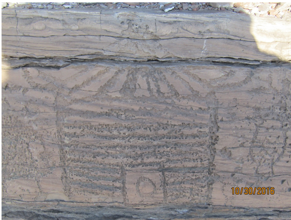
Рис. 3. Тип срубного жилища с изображением входа и очага (без масштаба)

«самцовая». По своей конструкции она является продолжением сруба дома. Дома с такой крышей можно увидеть в ХКМ и в настоящее время. Технология ее изготовления такова: тес укладывают на горизонтальные бревна – слегы. Концы слег врубаются в поперечные бревна сруба («самцы»), образуя треугольный фронтон. Чтобы тесины не соскальзывали, их снизу поддерживает бревно-поток, опирающееся на «курицы», которые сейчас практически исчезли как конструктивный элемент крыши. Раньше у русских старожилов на него крепили желоб-«водотечник». Технологически такая крыша даже могла рубиться отдельно от дома, а потом собираться на срубе. Для ее изготовления требовалось больше материала, чем для простых крыш (ПМА, А. Г. Калачёв). Видимо, это явилось одной из причин большего распространения последних. Наличие самцовых крыш в жилищах тагарцев является свидетельством ее распространения уже в столь глубокой древности.