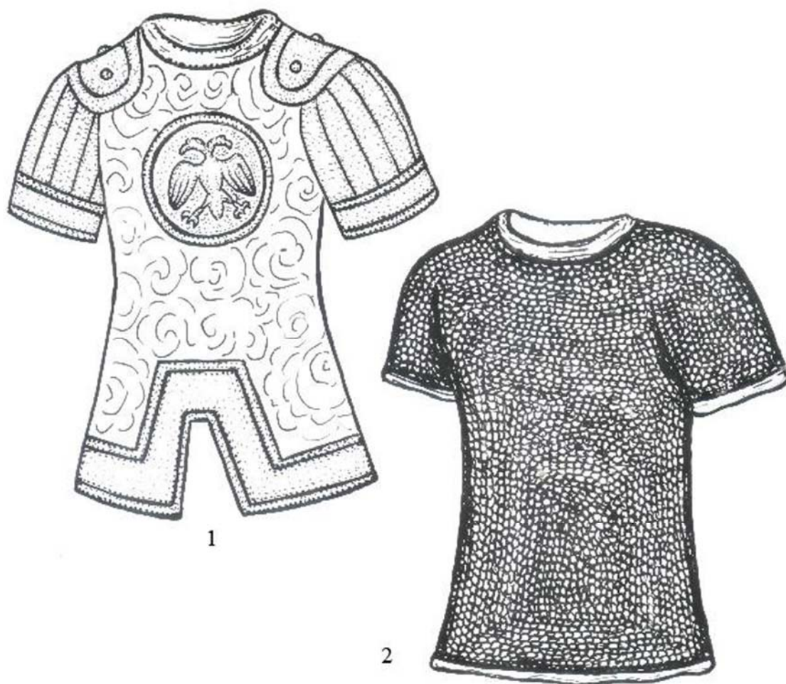
Рис. 2. Реконструкция доспехов Ермака: 1 – доспех с мишенями; 2 – кольчатый доспех (без масштаба)

в период совершения посольства У. М. Ремезова в ставку Абляя-тайши. После этого посольства каких-либо сведений о дальнейшей судьбе доспеха в источниках не содержится. Вполне вероятно, что составитель летописи, или художник, иллюстрировавший события, относящиеся к посольству, могли получить сведения об особенностях этого доспеха непосредственно от У. М. Ремезова, который сам его видел, держал в руках и вручал Абляю-тайше.