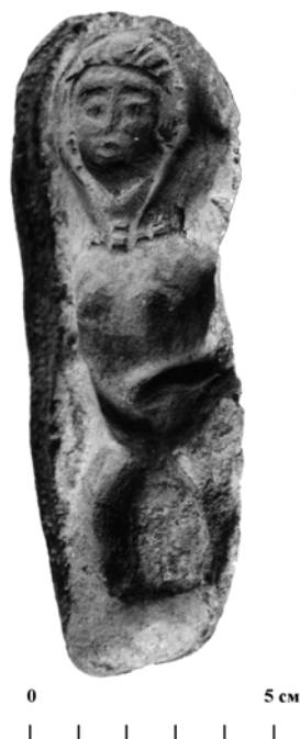
Рис. 3 (фото). Матрица (калып) для изготовления женских терракотовых фигурок из поселения Арапхана (из материалов раскопок А. А. Бурханова)

В научной литературе аналогичные типы мужской скульптуры известны как «идольчик» или «всадник-уродец». Арапханинская статуэтка «всадника», возможно, некогда посаженная на конька, выполнена грубо,