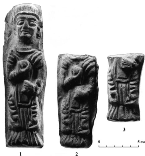
Рис. 2 (фото). Терракотовые фигурки богини плодородия из поселения Арапхана (из материалов раскопок А. А. Бурханова)

Первая из них, найденная во время земляных работ в 1988 г., интересна тем, что сохранилась целиком, во весь рост, и реалистически изображает тщательно проработанную фигурку женщины в длинном одеянии (рис. 2, 1).