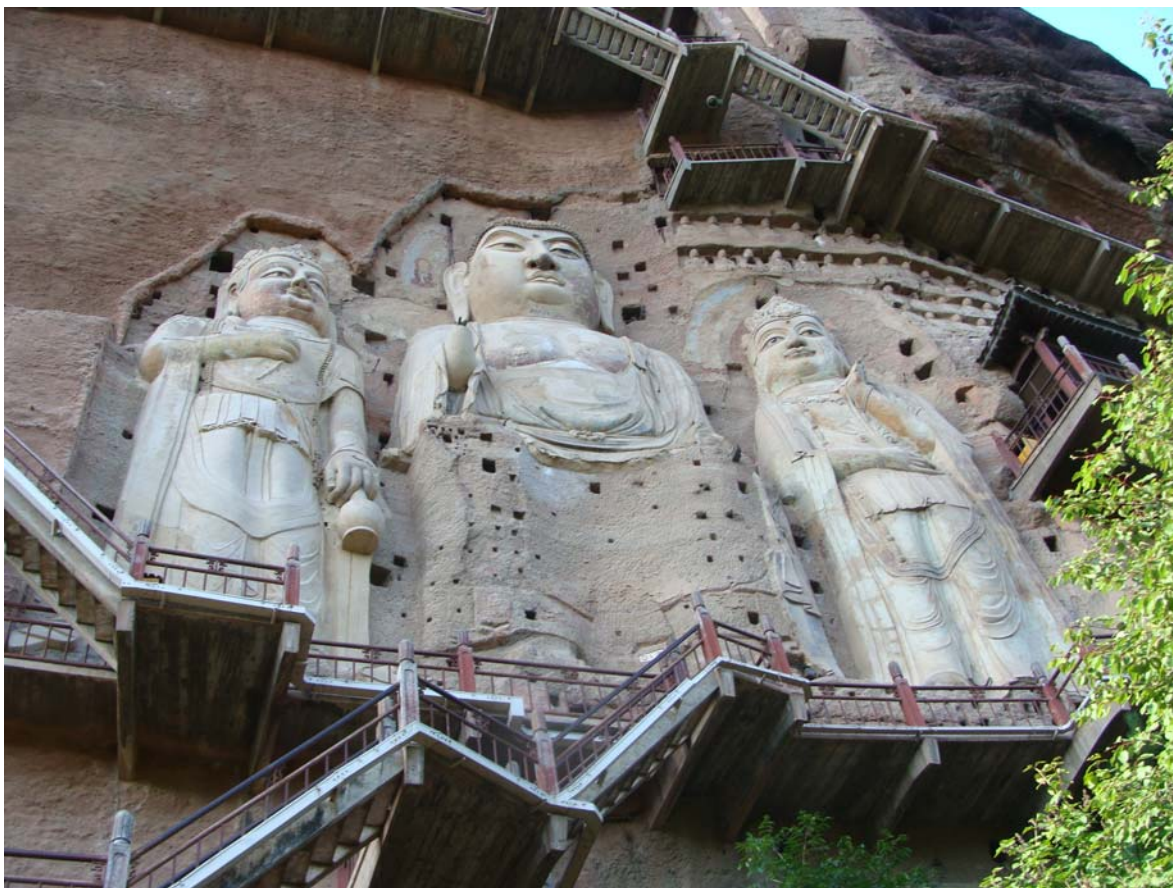
Рис. 2. Будда и бодхисаттвы в нише № 13: династия Суй, реконструкция при династии Мин

подробно представляет картину рая со многими пейзажами, строениями, людьми, иллюстрируя эсхатологические настроения амидаизма, получившего распространение в то время.