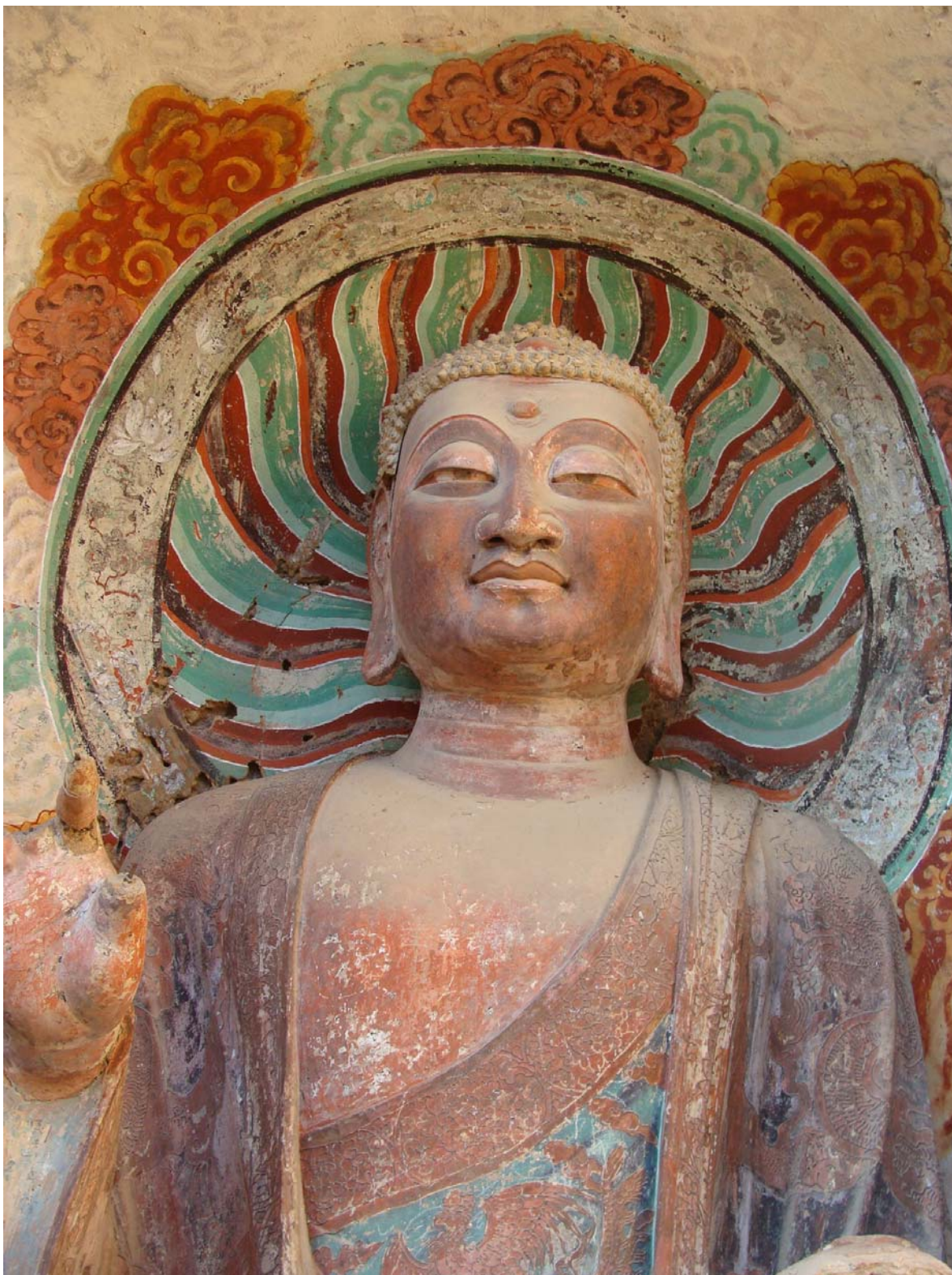
Рис. 4. Будда Шакьямуни из левой ниши грота № 5: династии Суй-Тан