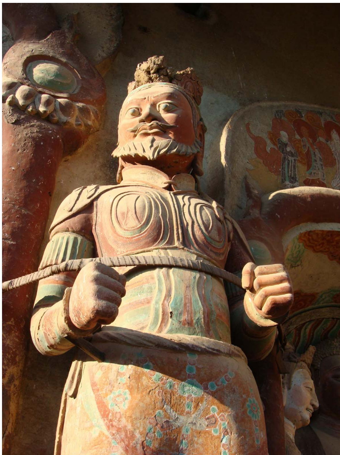
Рис. 5. Небесный царь, попирающий быка, из грота № 5 (фото авторов)