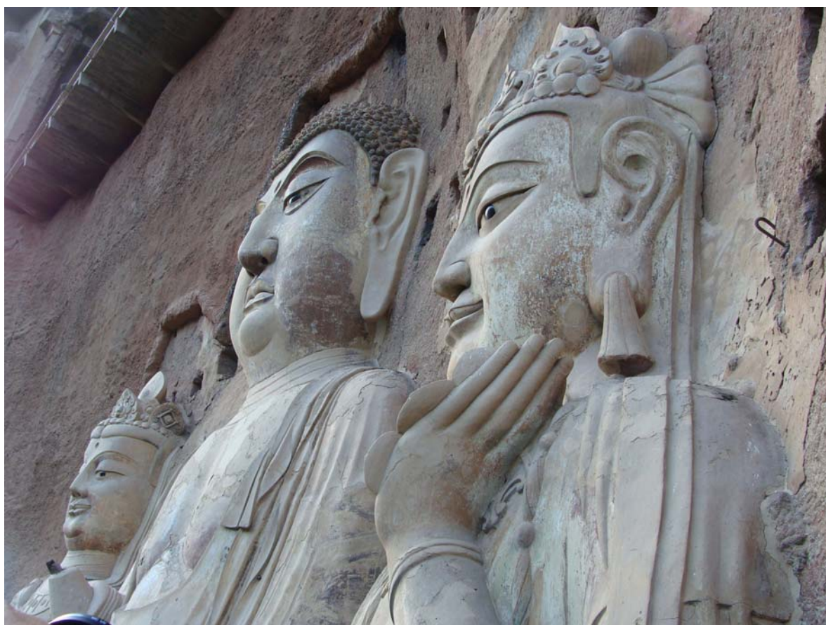
Рис. 3. Деталь скульптурной группы из ниши № 13

количественного и качественного подъема, который имел место в Дуньхуане [Dun Huang..., 2012. P. 42–45, 62–69] и особенно в Лунмэне [Дин Минъи, 1979]. Сдерживающим фактором мог оказаться ряд разрушительных землетрясений [Дун Юйсян, 1983. С. 29]. Характерны для этого периода полихромные фигуры (рис. 4). Одна из фигур в композиции пещеры № 5 – воин в доспехах, обычно воспринимаемый в качестве Небесного царя, стоящего на быке (рис. 5), трактуется исследователями как возможное воспроизведение Господа Шивы и его белого быка Нандин [Shrotriya, Zhou Xueying, 2007]. Это может свидетельствовать о значительной устойчивости базовых индийских канонов либо о вторичном влиянии из Индии благодаря активному развитию торговых и культурных контактов Китая с внешним миром в эпоху Тан. Отметим также, что сам внешний облик этого персонажа явно не китайский и, скорее, соответствует среднеазиатскому («согдийскому») типу. Таким