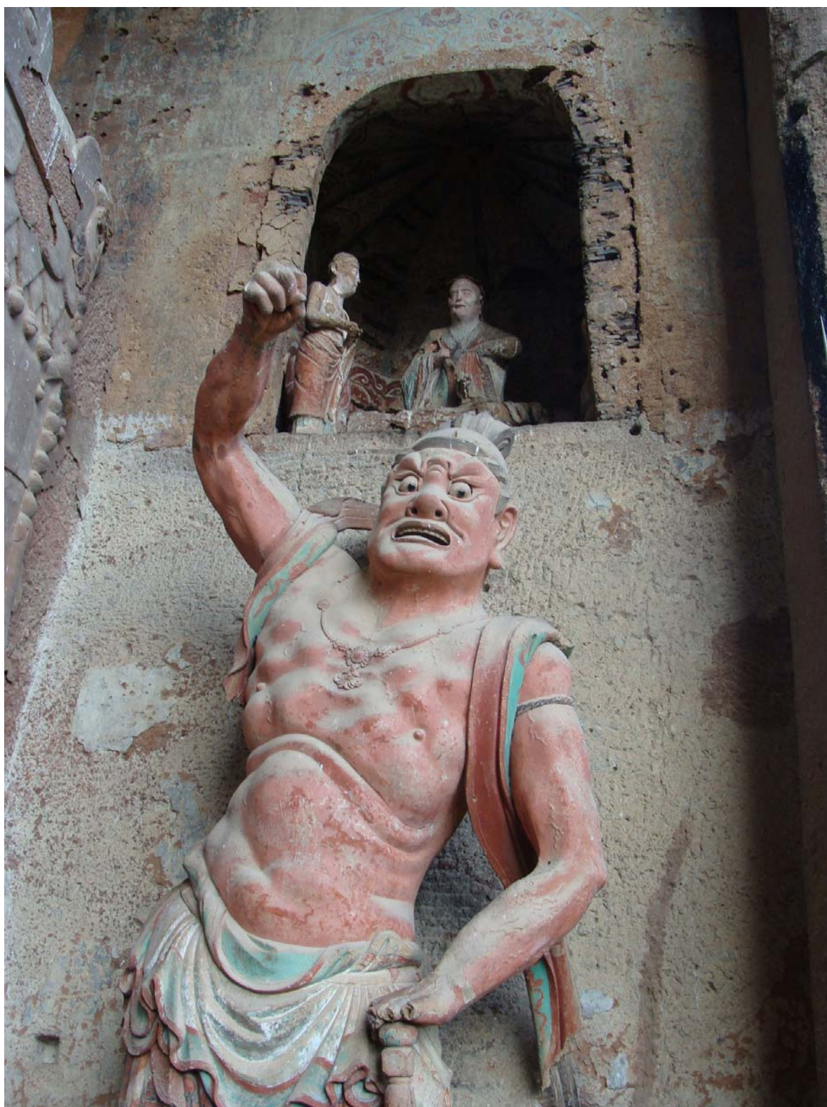
Рис. 6. Фигура стража во «Дворце семи будд» в пещере № 9: династия Северное Чжоу, реконструкция при династии Северная Сун