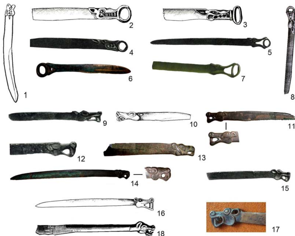
Рис. 1. Изображения волков в декоре тагарских ножей: 1 – могильник Хыстаглар (курган 1, ограда Б, м. 1) [Евразия..., 2005. Рис. 3.13]; 2 – Минусинский край (МКМ, инв. № 3936); 3 – Байкалово (МКМ, инв. № 3967); 4 – в 35 верстах от г. Красноярск, с. Терехино (по: [Завитухина, 1983. Кат. 208]); 5 – к северу от г. Минусинска (по: [Завитухина, 1983. Кат. 209]); 6 – Жеблахты (МКМ, инв. № 3965); 7 – правый берег р. Енисей на север от Минусинска [Радлов, 1888, Табл. III. 20]; 8 – у с. Новоселово [Богданов, 2006. Табл. СІХ, 9]; 9 – Сибирь (по: [Завитухина, 1983. Кат. 205]); 10 – Минусинский край (МКМ, инв. № 3942); 11 – Марьясова (МКМ, инв. № 3987); 12 – Минусинский округ, р. Сыда [Завитухина, 1983. Кат. 207]; 13 – Городок (МКМ, инв. № 3988); 14 – Каптырево (МКМ, инв. № 3983); 15 – Минусинский округ, с. Игрыш (по: [Завитухина, 1983. Кат. 206]); 16 – Галактионово (МКМ, инв. № 3932); 17 – Беллык (МКМ, инв. № 3925); 18 – Галактионово (МКМ, инв. № 3966) (1–18 – бронза; без масштаба)

Первая из них – изображение головы волкообразного хищника в качестве навершия ножа, происходящего из могильника Хыстаглар (курган 1, ограда Б, могила 1) [Евразия..., 2005. Рис. 3.13] (рис. 1, 1). Изображение отличается от всех выделенных ниже групп. Морда хищника тупая, прямо-