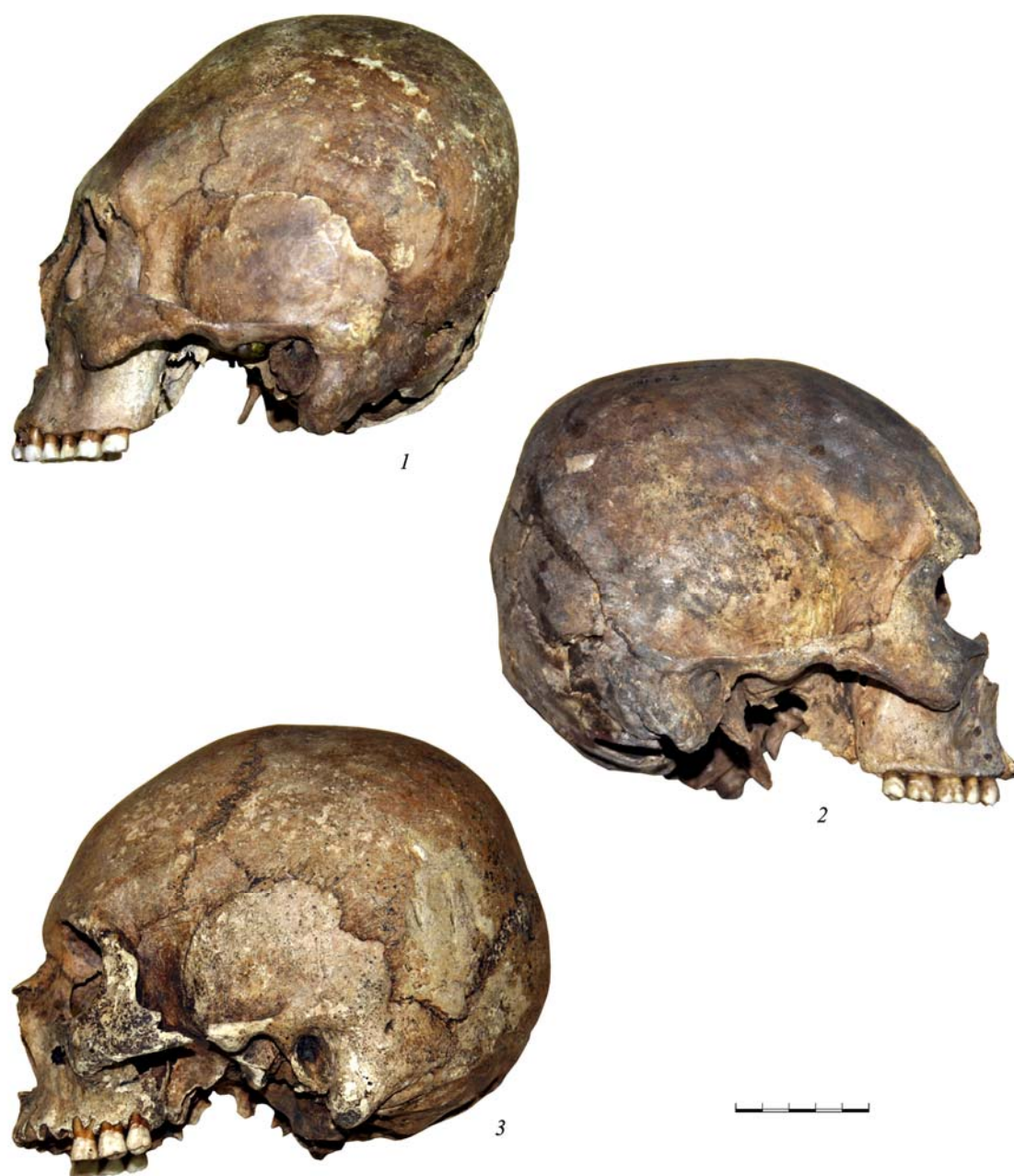
Рис. 1 (фото). Кольцевая деформация на черепах: 1 – женский череп из погребения 2 кургана 11 могильника Карасье 9; 2 – мужской череп из погребения 2 кургана 6 могильника Гаёвский 1; 3 – мужской череп из погребения 4 кургана 6 могильника Мурзинский 1 (по: [Шарапова, 2007. С. 65. Рис. 4])

претировать некоторые травматические поражения у женщин боевыми [Berseneva, 2008]; близкая точка зрения по аналогии со скотоводческими обществами Евразии была высказана Б. Хэнксом [Hanks, 2008]. Имеющиеся сегодня данные антропологического анализа, прежде всего, исследования травматических поражений населения саргат-