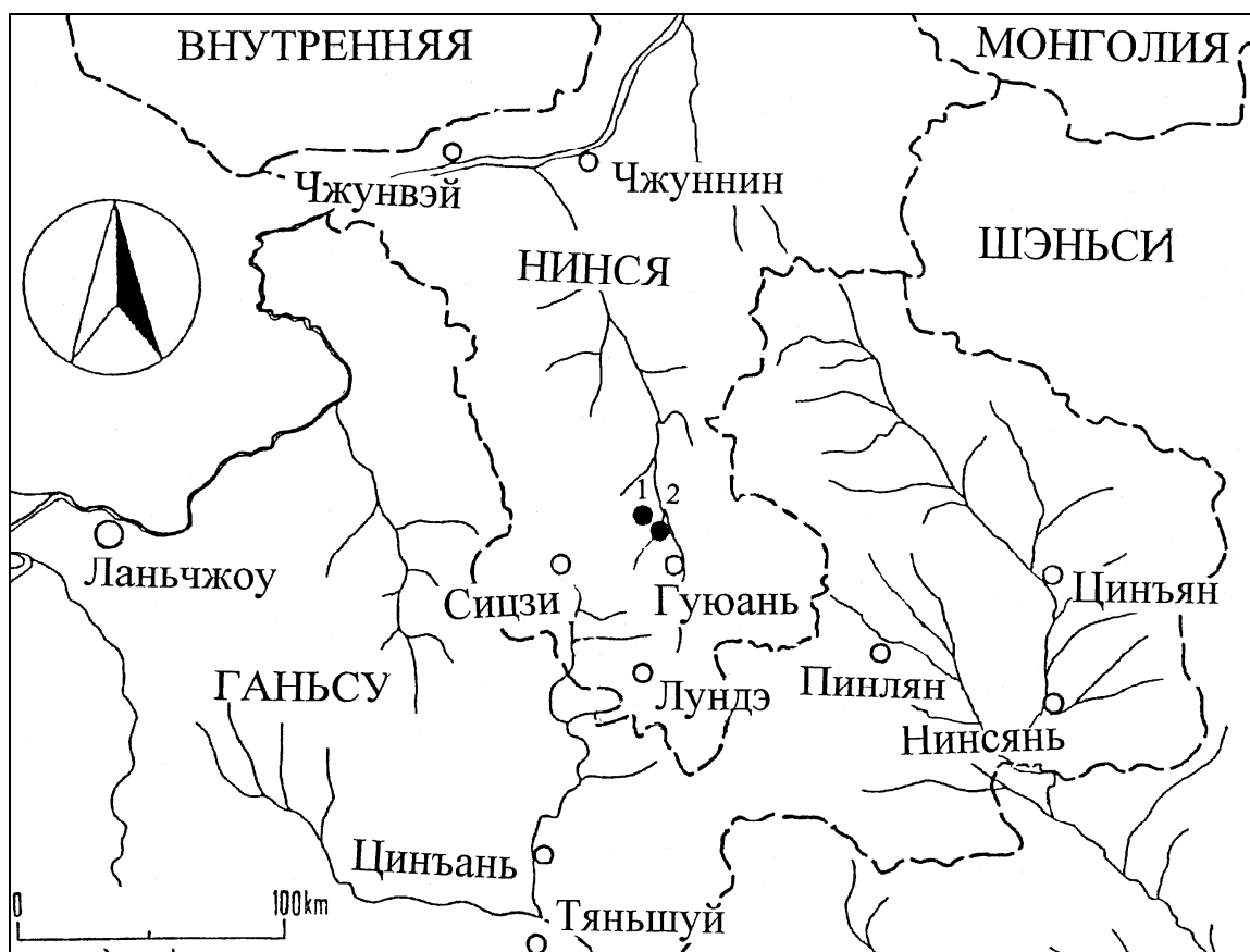
Рис. 3. Памятники скифо-сакского времени в уезде Гуюань Нинся-Хуэйского автономного района: 1 – Мачжуан; 2 – Юйцзячжуан