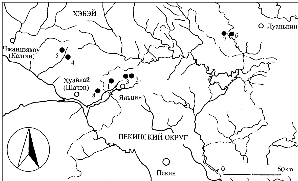
Рис. 2. Памятники скифо-сакского времени на южном склоне гор Яньшань: 1 – Юйхуанмяо; 2 – Хулугоу; 3 – Силянгуан; 4 – Баймяо; 5 – Сяобайян; 6 – Паотайшань; 7 – Лишугоумэнь; 8 – Бэйсиньбао