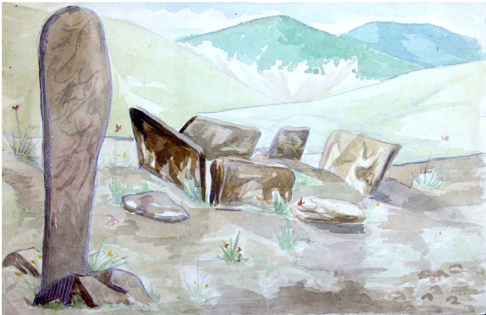
Рис. 1. Рисунок плиточной могилы, сделанный Н. П. Михно в ходе экспедиции 1927 г. (по: [ККМ. НА С. А. Успенского. № 19])