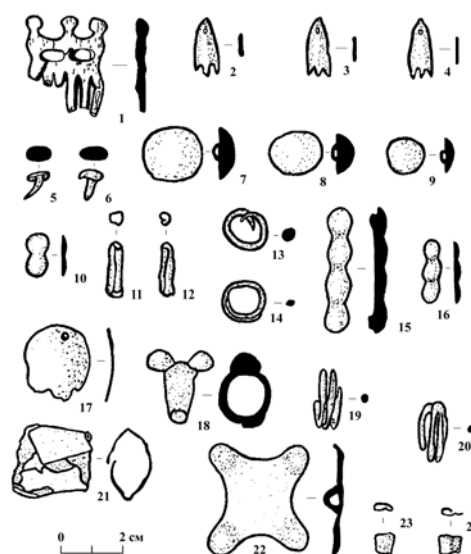
Рис. 1. Украшения могильника Белый Яр V: 1 – гребень; 2–4 – лапчатые привески; 5–6 – гвоздики-заклепки; 7–9 – пуговицы; 10 – двухъярусная бляшка; 11–12 – бусины-пронизки; 13–14, 19–20 – височные кольца; 15 – четырехъярусная бляшка; 16 – трехъярусная бляшка; 17 – оваловогнутая бляшка; 18 – перстень; 21 – браслет; 22 – четырехлепестковая бляшка; 23–24 – обоймочки (1 – кость, 2–24 – бронза)

Еще одна находка литых массивных серег была сделана во время раскопок женского погребения могильника Чазы на севере Минусинской котловины [Паульс, 2000. С. 107]. К настоящему времени зафиксировано только два случая обнаружения этих украшений в Минусинской котловине – на севере (Чазы) и в районе устья Абакана (Белый Яр V). Можно предположить, что данные серьги нашивались на головной убор, так как концы литых серег достаточно толстые и просунуть их в отверстие мочки уха невозможно.