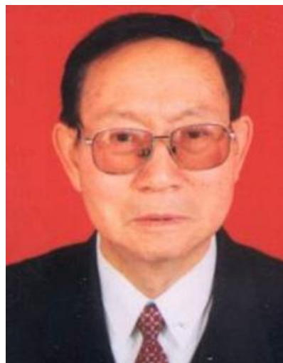
Рис. 1 (фото). Гай Шаньлинь (1935–2020)

Будучи студентом, Гай Шаньлинь запомнил слова одного из своих преподавателей, который сетовал, что в Китае, в отличие от Европы, нет наскального искусства. Еще тогда у молодого специалиста возникли сомнения: может быть, наскальные рисунки в Китае просто не нашли или даже не искали? Гай Шаньлинь выяснил, что средневековый географ Ли Даюань, живший при династии Северная Вэй, упомянул в своем классическом трактате «Шуй цзин чжу» («Канон вод с комментарием») 22 местонахождения с наскальными рисунками. Позднее Гай Шаньлинь опубликовал статью «Ли Даюань и китайские петроглифы» (1983).