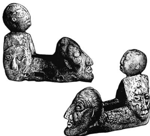
Рис. 3. Бронзовый предмет с изображениями человеческих лиц из Дахуачжун (по: [Ковалев, 2001. С. 163, рис. 2, 5, 6]; без масштаба)

Однако мы не знаем, где изображены собственно «каясцы», а где их соседи. Судя по предпринятому нами обзору основных параметров культуры кая (равно как и рассмотренной ранее культуры сыба), в рамках