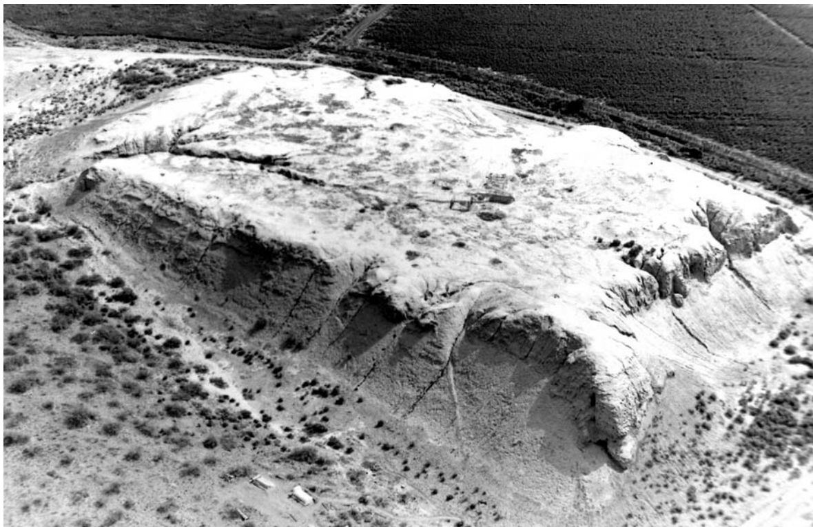
Рис. 2. Цитадель городища Ходжа-Ярык-депе (снято с вертолета с юго-восточной стороны; фото 1993 г.)