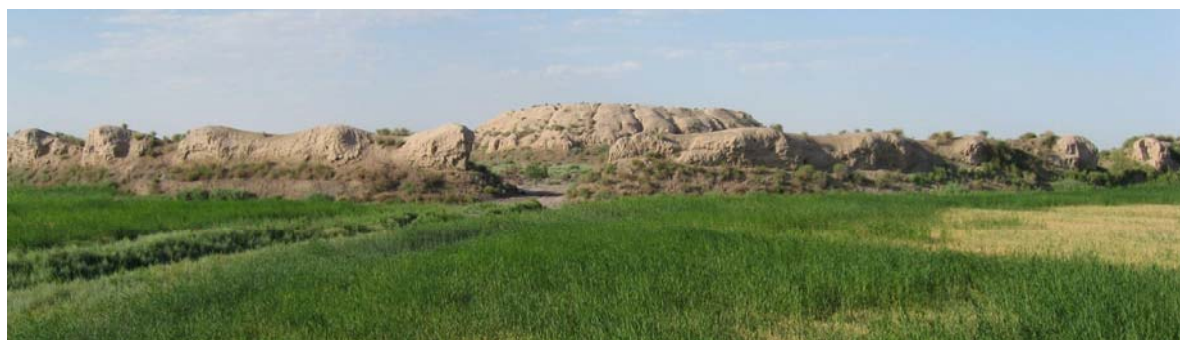
Рис. 5. Городище Одей-депе (снято с восточной стороны; фото 2007 г.)

менабате) [Бурханов, 1997. С. 112–113; 2003. С. 168–169; 2005а. С. 38].