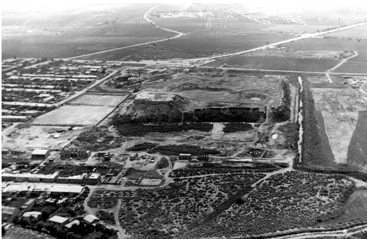
Рис. 3. Городище Амуть – Чарджуй (снято с вертолета с западной стороны; фото 1993 г.)