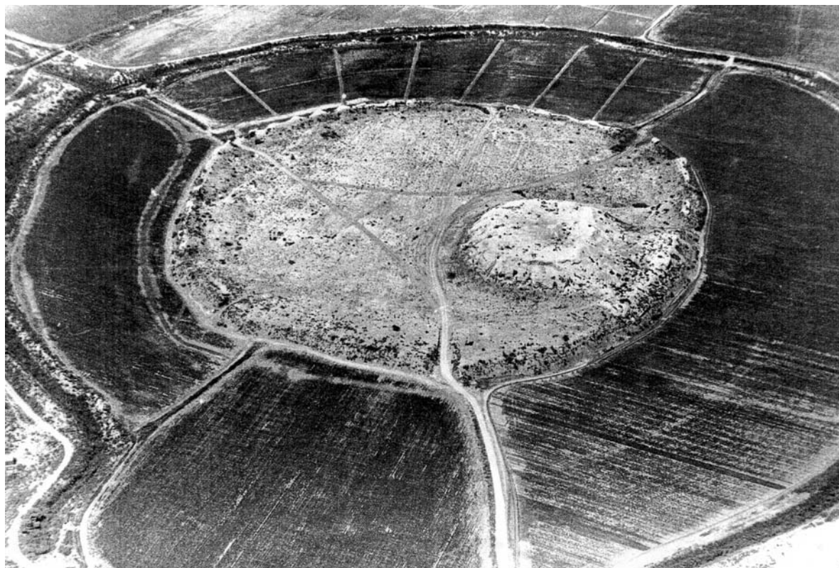
Рис. 4. Городище Одей-депе (снято с вертолета с восточной стороны; фото 1993 г.)