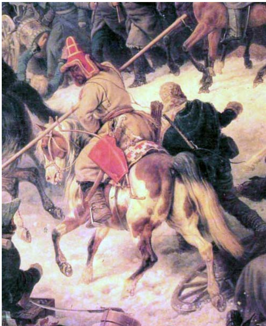
Рис. 4. Фрагмент картины П. Гесса «Переправа через Березину, 16 ноября», 40-е гг. XIX в. (ГЭ, Санкт-Петербург)

времени. Последние, как и «малакаи», снабжены высокой толстой (амортизирующей удар) конической тульей, широкими наушниками и назатыльником [Бобров, Худяков, 2008. С. 472, 473].