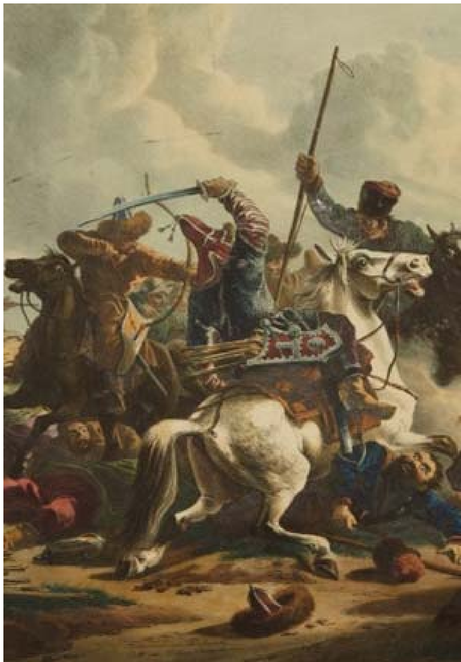
Рис. 3. Фрагмент картины А. О. Орловского «Бой казахов с уральскими казаками», конец XVIII – начало XIX вв. (РНБ, Санкт-Петербург)

на себе следы разрывов и разрезов, образованных вследствие воздействия клинкового оружия. Это подтверждает данные изобразительных источников о применении «малакаев» в рукопашном бою. Бросается в глаза конструктивное сходство шапки с «мягкими шлемами» (рус. «шапками бумажными») восточноевропейских и азиатских воинов позднего Средневековья и раннего Нового