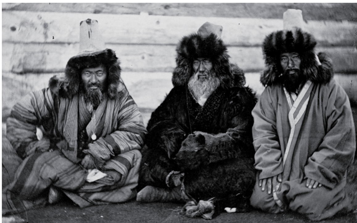
Рис. 6 (фото). «Три бия Бозашыньских казахов. Западный Казахстан» (из Альбома «Народности юга России», вторая половина XIX в.; РНБ, Санкт-Петербург)