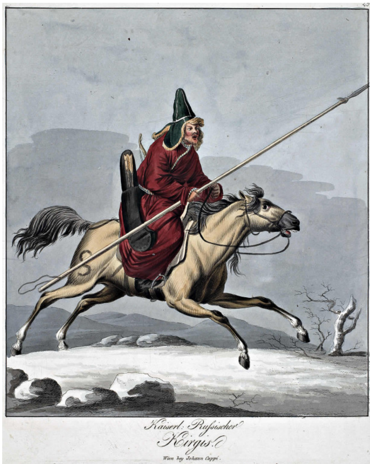
Рис. 2. Рисунок И. Каппи «Киргиз (казах)», начало XIX в. (частная коллекция)

в период военных действий: непосредственно в бою (рис. 1, 1, 2, 7), в походе (рис. 1, 8) или в дозоре (рис. 1, 5). В казахской юрте XVIII в. «малакай» висел рядом с предметами вооружения: ружьем, ружейным поясом