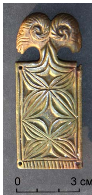
Рис. 1 (фото). Костяная накладка из Кочкорской долины

Схожие по конструкции парные орнаментированные геометрическим узором плоские костяные пластины от игольника с «крыловидно оформленной верхней частью» были обнаружены в древнетюркском женском захоронении с конем на могильнике Узунтал VIII, находившемся в одноименной долине в юго-восточной части Горного Алтая. Они располагались около правого запястья погребенной [Савинов, 1982. С. 111, рис. 5, 25]. Еще одна пара орнаментированных кос-