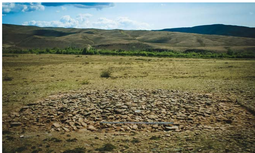
Рис. 1 (фото). Могильник Ак-Даг I, курган 1, горизонт I, вид с запада