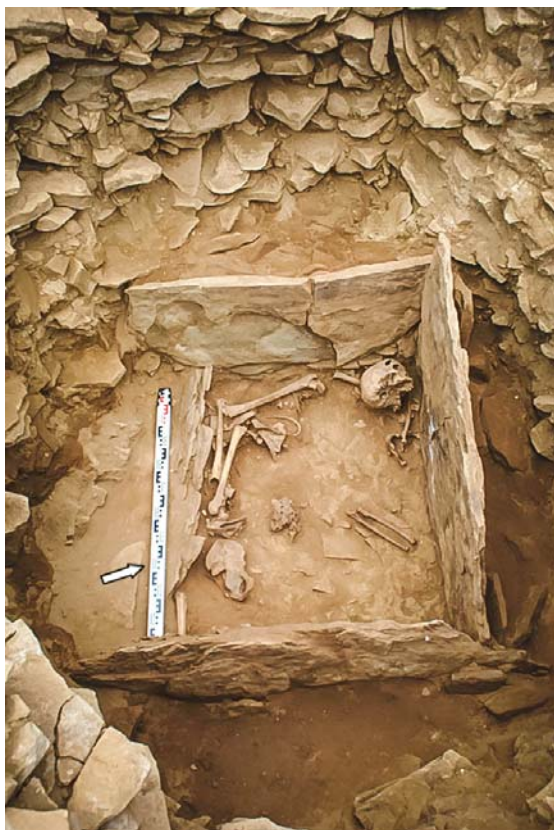
Рис. 4 (фото). Могильник Ак-Даг I, курган 1, могила 1