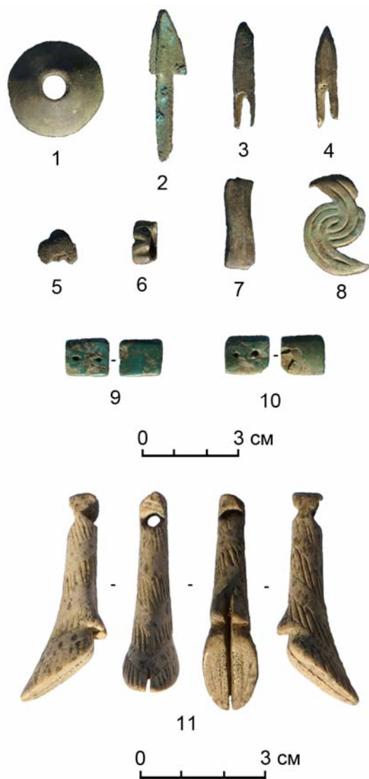
Рис. 7. Могильник Ак-Даг I, курган 1, могила 1, погребальный инвентарь: 1 – бронзовая ворворка; 2–4 – бронзовые наконечники стрел; 5–8 – бронзовые поясные накладки; 9–10 – нашивки из бирюзы; 11 – роговая подвеска

неоднократно наблюдались и на других погребениях раннескифского времени, но наиболее полно зафиксированы на кургане Аржан I [Грязнов, 1980. С. 9–10; Грач, 1980. С. 25].