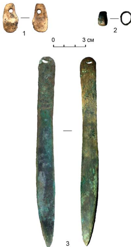
Рис. 8. Могильник Ак-Даг I, курган 1, могила 3, погребальный инвентарь: 1 – подвеска из клыка марала; 2 – бронзовая обойма; 3 – бронзовый нож

Одним из хронологических индикаторов раннескифских памятников Тывы являются украшения из бирюзы (рис. 7, 9, 10). Прямые аналоги нашивкам из бирюзы имеются в кургане Аржан I [Грязнов, 1980. Рис. 10, 2; Грач, 1980. С. 25]. Украшения также представлены подвесками из рога в виде ноги оленя и клыка марала (рис. 7, 11; 8, 1). Подвески из клыка марала использовались населением Южной Сибири с эпохи бронзы до исторического времени. Наибольший интерес представляет подвеска, вырезанная из рога с отверстием для подвешивания в верх-