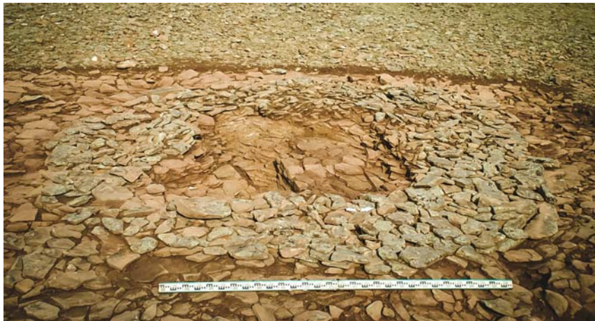
Рис. 6 (фото). Могильник Ак-Даг I, курган 2, горизонт II, вид с запада

Как и в других курганах раннескифского времени Тывы, каменное сооружение кургана 1 могильника Ак-Даг I имеет в плане округлую форму с плоской вершиной и сложено из бессистемно составленных обломков горных пород и валунов. По периметру кургана прослеживаются остатки обкладки-крепиды из более крупных камней. Данные особенности каменных сооружений