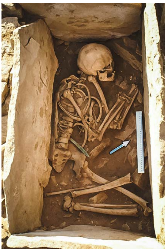
Рис. 5 (фото). Могильник Ак-Даг I, курган 1, могила 3

костей (ключицы, позвонки, ребра, фаланги) найдена в заполнении ящика. Крупные кости – череп, тазовые, лопатки, крестец, кости рук и ног, а также часть ребер и позвонков находились в разрозненном состоянии на дне ящика (рис. 4). Предварительные антропологические наблюдения свидетельствуют о том, что кости умершего мужчины, включая череп, отличаются большими размерами и массивностью.