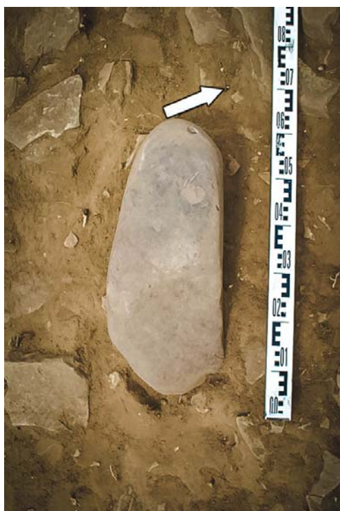
Рис. 2 (фото). Могильник Ак-Даг I, курган 1, олений камень в насыпи кургана

ются многочисленные выходы выветрившегося песчаника. Некоторые из них имеют правильную округлую форму, чем напоминают каменные насыпи древних курганов. Площадь памятника усеяна обломками песчаниковых плит. Поверхность каменных конструкций курганов перекрывала супесь светлого цвета, состоящая из песка и небольшого количества гумуса, с редкими