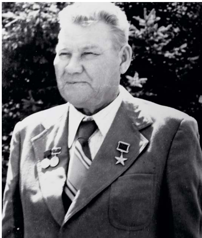
Рис. 1 (фото). Академик Алексей Павлович Окладников