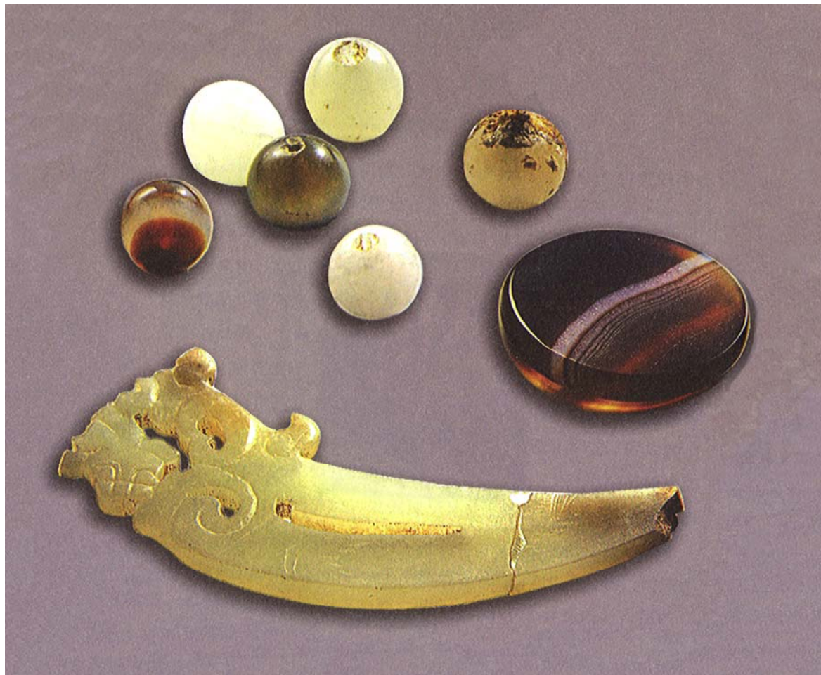
Рис. 1. Украшения (подвеска и бусины) из нефрита, агата и хрусталя, найденные в могиле Цао Цао (по: [Цао Цао му чжэньсян, 2010. С. 62])

в том числе и в сопредельных с царством Вэй регионах. Несомненный интерес представляют архитектурно-строительные особенности самой конструкции гробницы, в том числе арочное перекрытие (рис. 2). Перспективным видится также изучение расположенной рядом могилы № 1 (предположительно старшей жены Цао Цао), которая меньше пострадала от грабежей и в целом окружающей территории, где обычно располагались многочисленные жертвенники и поминальные объекты. Вспомним, что знаменитые терракотовые статуи были обнаружены на изрядном (около 1,5 км) расстоянии от собственно могилы Цинь Шихуанди!