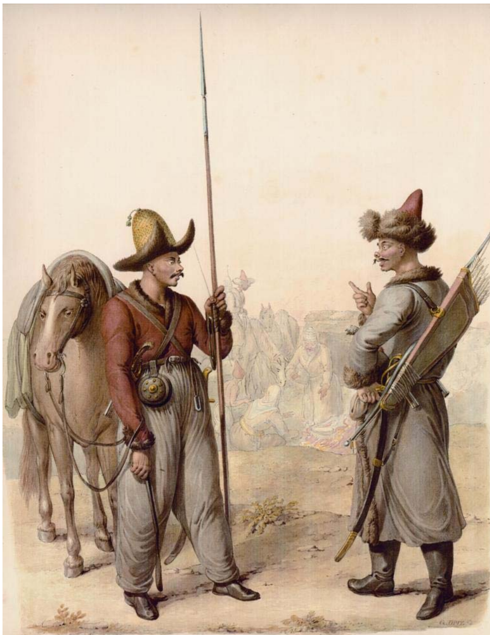
Рис. 1. Акварель Г. Опица (1775–1841 гг.) «Казак и башкир», начало XIX в. (частное собрание, Казахстан)

в XVIII–XIX вв. 1 Целью работы является выявление источников поступления российских сабель в казахские войска на протяжении XVIII–XIX вв., определение основных категорий потребителей данного клинкового оружия, фиксация типов российских са-