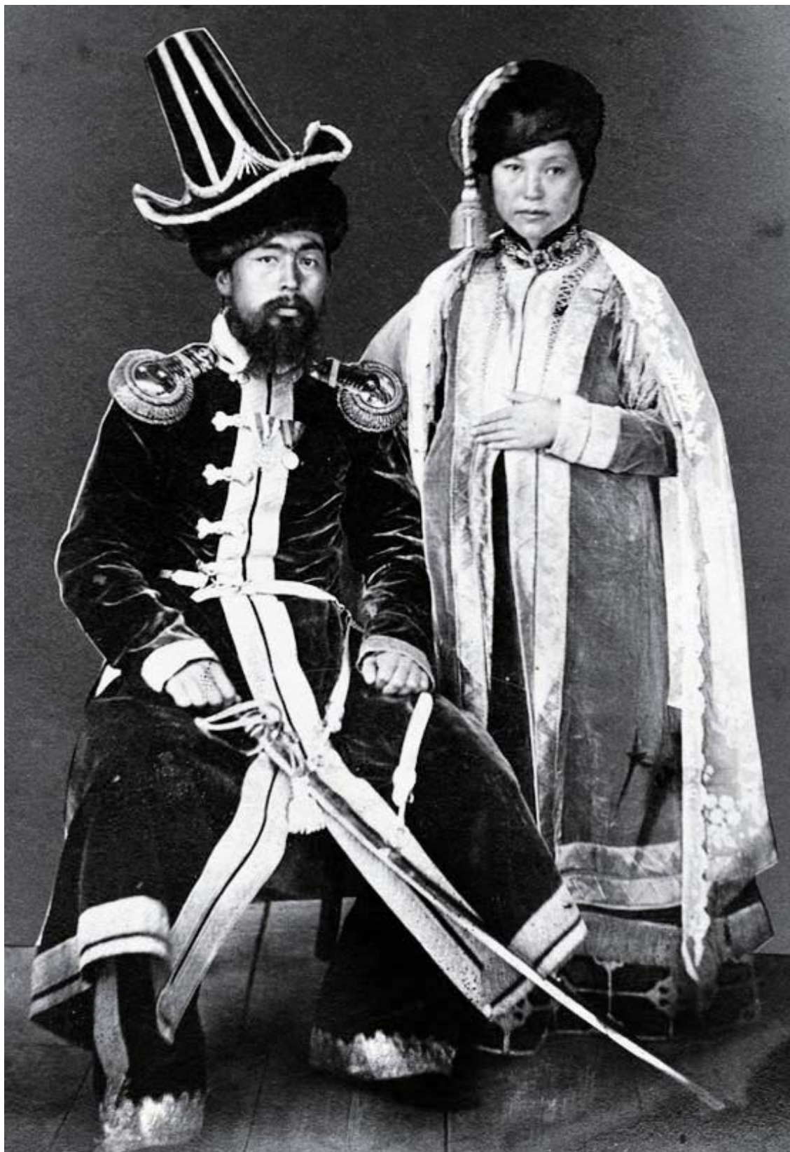
Рис. 3 (фото). Знатный казах с женой («киргизский хан с женой»), 2-я половина XIX в. (Санкт-Петербург, архив РГО. Р. 112, оп. 1. № 974)