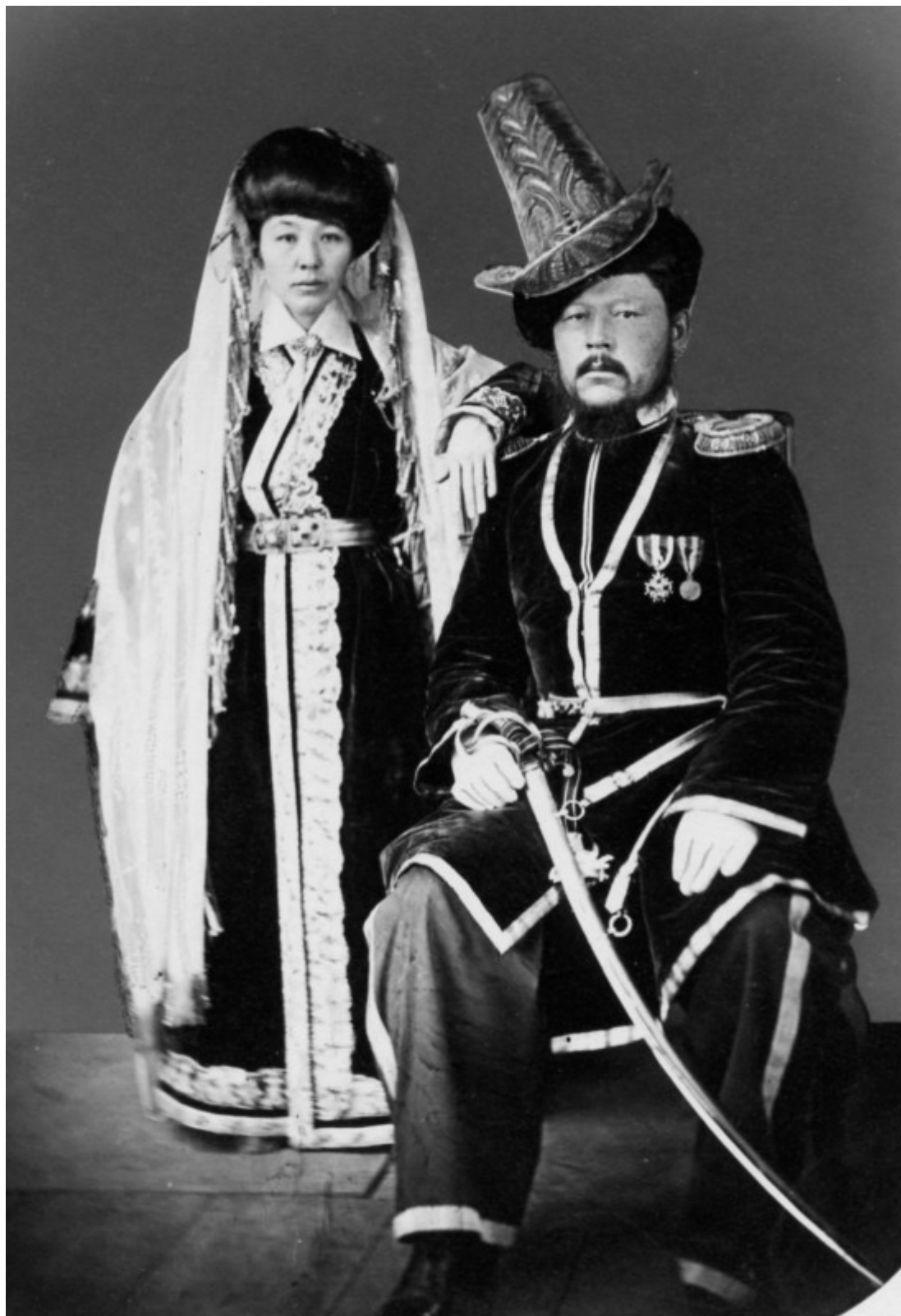
Рис. 2 (фото). Знатный казах с женой, г. Астрахань, 1873 г. (РГО, Санкт-Петербург; РНБ, Д-К. – Б. м., 1873 г. Э АлТ 63/2-А 913 «Киргизский хан с женою»)