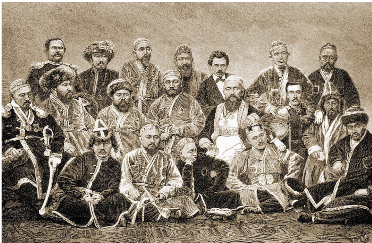
Рис. 4 (фото). «Депутация казахов Зайсанского края в Москве, имевшая счастье представляться Е. И. В.», 1873 г. (по: [Всемирная иллюстрация, 1873. Т. 9. С. 141])

частных собраниях Республики Казахстан хранится несколько десятков сабель российского производства. Часть из них применялась казахскими воинами в XIX в., что зафиксировано изобразительными источниками (рисунками и фотографиями) (рис. 2–4). Сопоставление вещественных и изобразительных материалов с эталонными уставными образцами российского клинкового оружия позволяет выделить основные типы сабель (рис. 5), применявшихся казахскими воинами XIX в. В частности, выделены кавалерийские сабли образца 1809 (рис. 5, 1) и 1827 гг., кавалерийские офицерские сабли образца 1817 г. (рис. 5, 2) и 1827 г. (рис. 5, 3), пехотные офицерские сабли образца 1855 г. (рис. 5, 4) и 1865 г. (рис. 5, 5), драгунские сабли образца 1841 г. (рис. 5, 6), драгунские «шашки» (сабли) образца 1881 г. (рис. 5, 7)