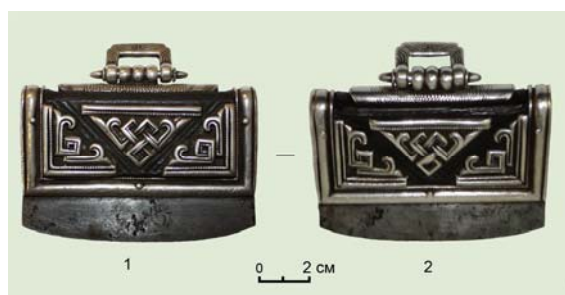
Рис. 5. (фото). Огниво с украшением в виде «узла счастья» (шифр фондового хранения ДМ 250 № 9274/1): 1 – передняя сторона; 2 – задняя сторона