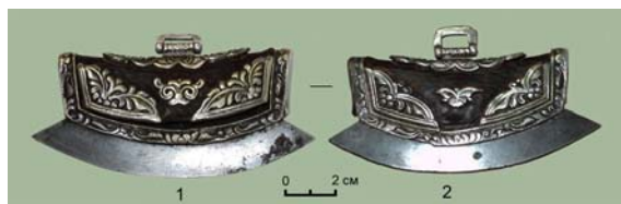
Рис. 2 (фото). Огниво со следами коррозии на лезвии (шифр фондового хранения КП 9321): 1 – передняя сторона; 2 – задняя сторона