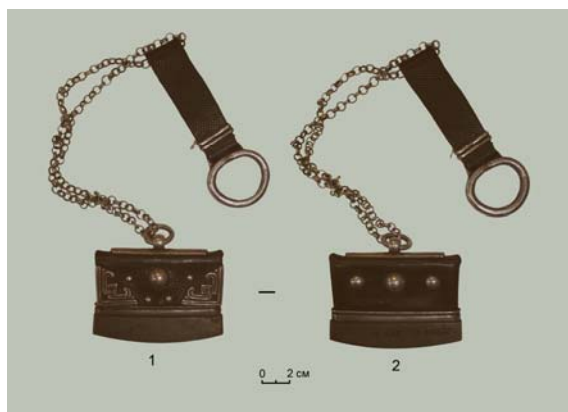
Рис. 3 (фото). Огниво на кольчатой цепочке с неорнаментированным терги (шифр фондового хранения КП 9766/2): 1 – передняя сторона; 2 – задняя сторона

лу» растения. Данный художественный прием характерен для тюрко-монгольского растительного орнамента.