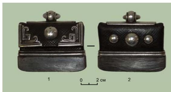
Рис. 4. (фото). Огниво со следами изношенности и коррозии лезвия (шифр фондового хранения КП 9526): 1 – передняя сторона; 2 – задняя сторона

Седьмое огниво имеет подвеску округлой формы. Шифр фондового хранения КП 4076/131 (рис. 7). Сохранность полная, кожа темно-коричневого цвета со следами потертости. Размеры 8,2 \times 5,5 см. На двойном кожаном шнурке прикреплена подвеска в виде округлой серебряной бляхи с крупной вставкой, изготовленной из стенки раковины.