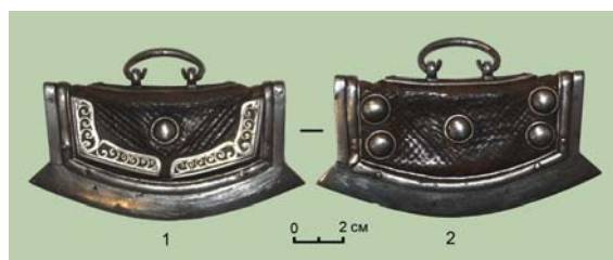
Рис. 6 (фото). Огниво с орнаментированными угловыми накладками на лицевой стороне (шифр фондового хранения ДМ 255 № 5033): 1 – передняя сторона; 2 – задняя сторона