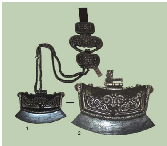
Рис. 1 (фото). Огниво на витой цепочке с орнаментированным терги (шифр фондового хранения КП 10296/3а): 1 – передняя сторона; 2 – передняя сторона (увеличено, без масштаба)