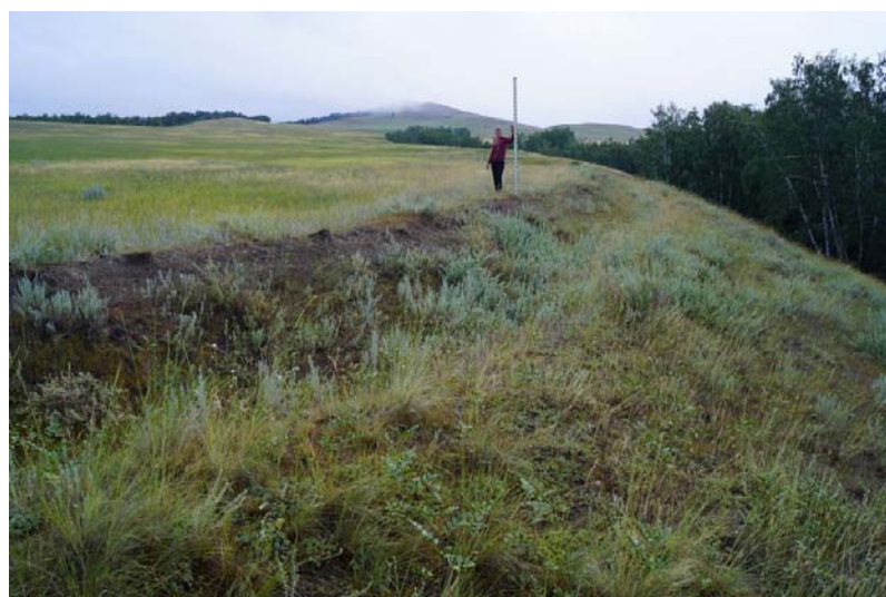
Рис. 5 (фото). Ров южной линии дополнительного оборонительного сооружения, проходящий вдоль края оврага (снято с ЗСЗ)

Но такая оборона была бы возможна, если существовало еще по одной линии рва и вала, замыкающих внутреннее пространство с востока и запада. В настоящее время, к сожалению, рельефно они никак не прослеживаются. Лишь от восточного окончания южных рва и вала к такому же окончанию северных рва и вала, расположенных приблизительно друг напротив друга, следует почти по прямой линии в северном направлении полоса растительности шириной около 1 м, заметно отличающаяся по цвету и составу от произрастающей вокруг (см. рис. 1, б). Цвет почвы по этой линии также