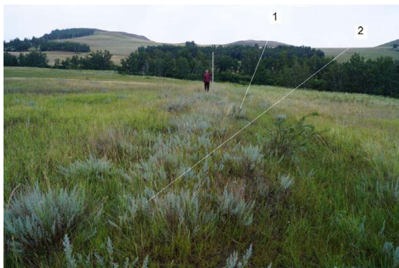
Рис. 4 (фото). Западная линия дополнительного оборонительного сооружения: 1 – ров; 2 – вал (снято с ССЗ)