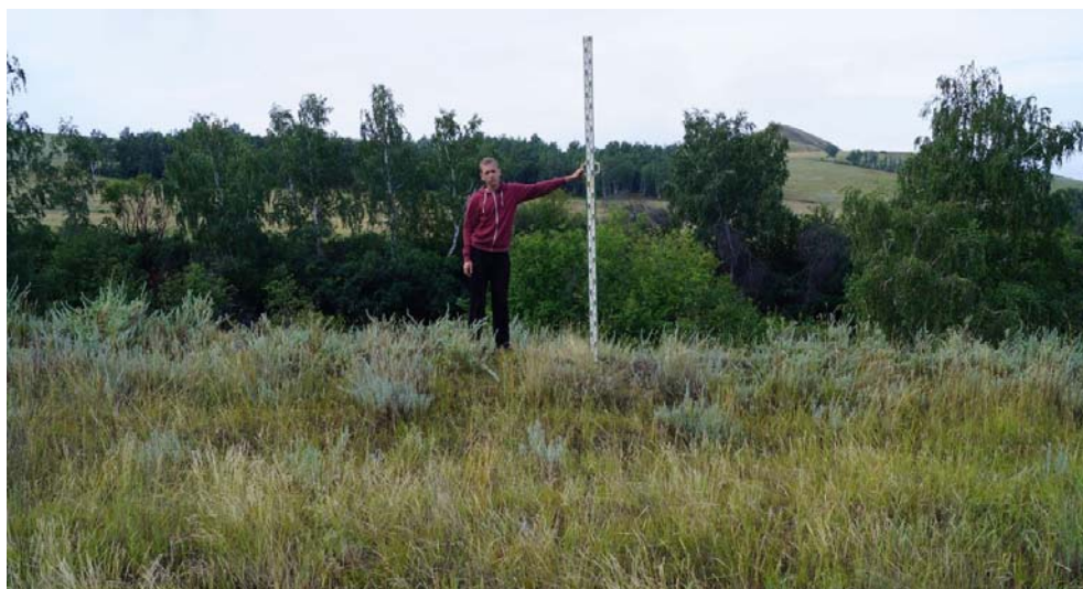
Рис. 6 (фото). Вал южной линии дополнительного оборонительного сооружения, проходящий вдоль края оврага (снято с С)

щихся, что недопустимо при использовании огнестрельного оружия. Кроме того, они находятся на обратном склоне возвышенности и не могут обеспечить эффективный обстрел северного сектора, откуда и мог преимущественно наступать враг. Известно также, что бои Гражданской войны на данной территории проходили зимой 1919–1920 гг., отличались кратковременностью и незначительным количеством участников, поэтому в такой ситуации подобные масштабные земляные работы проводиться не могли. Нижняя хронологическая граница сооружений определяется тем, что на одном из участков северная оборонительная линия пересекает площадь кургана тагарской культуры – вдоль южной части оградки, вплотную к ней. В результате во рву хорошо видна вертикально стоящая крупная плита девонского песчаника – элемент оградки кургана. Далее за курганом оборонительная линия тянется в основном по прямой, но имеет легкое отклонение к югу вблизи от второго кургана тагарской культуры. Насыпь этого кургана линия уже не пересекает и проходит снаружи, к югу от его оградки – для этого и было выполнено упомянутое отклонение. Через 60 м после второго кургана линия слегка отворачивает к северу, восстанавливая прежнее направление. Факты обнажения части каменной оградки тагарского кургана и уклонения от другого в ходе рытья рва и вала свидетельствуют о том, что это оборонительное сооружение не может датироваться временем ранее III в. до н. э.