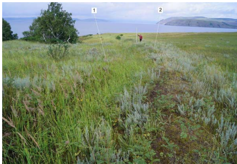
Рис. 2 (фото). Западная оконечность южной линии дополнительного оборонительного сооружения (снято с В): 1 – ров; 2 – вал