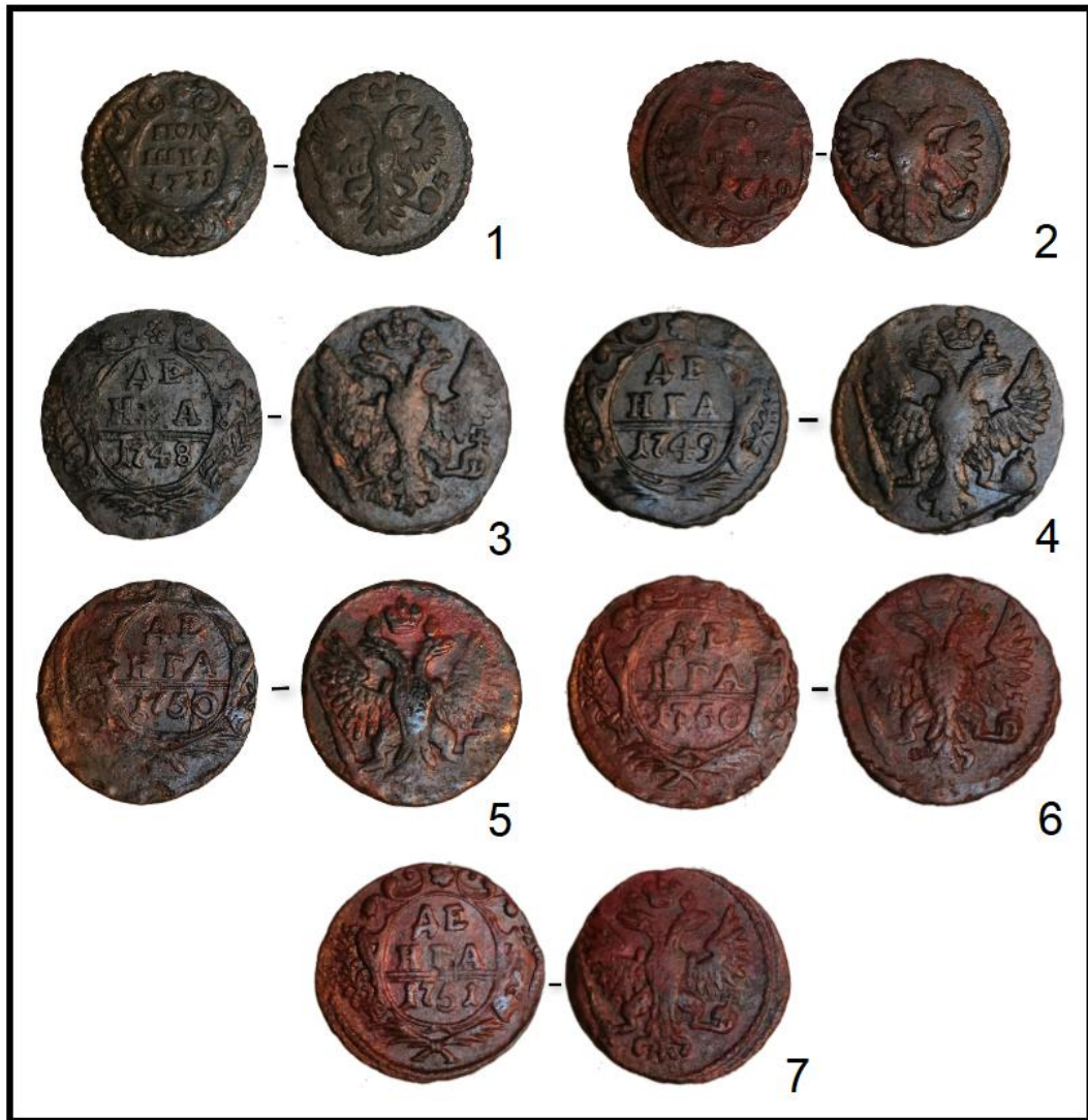
Рис. 5. Монеты, найденные жителями с. Повалиха: 1, 2 – полушка Анны Иоанновны; 3–7 – денга Елизаветы Петровны Fig. 5. Coins found by villagers in the village of Povalikha: 1, 2 – half of Anna Ioannovna; 3–7 – denga of Elizaveta Petrovna

Кроме рассмотренных выше сосудов на потревоженном земельном участке по улице Партизанской была собрана коллекция отдельных фрагментов керамики (43 шт.), которая включает в себя 15 венчиков, 16 элементов тулова, 9 фрагментов донной и придонной части, а также 3 венчика гончарной глазурованной керамики зеленого цвета. Большая часть найденных черепков относится к кухонной посуде и укладывается в типологические схемы, предложенные Л. В. Татауровой [2015, с. 149–151, рис. 1] и О. С. Мамонтовой [2012]. Ранее проведенный О. А. Федорук технико-технологический анализ образцов глазурованной керамики, обнаруженной в с. Повалиха, показал, что сосуды были изготовлены на гончарном круге из сильноожеженной глины и обожжены при высокой температуре (от 650–700 °С и выше) в окислительной среде [Федорук, Головченко, 2021, с. 164]. Вероятно, схожие результаты даст обследование и части новых выявленных материалов, скорее всего датированных XIX – началом XX в.