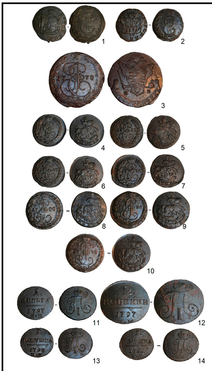
Рис. 6. Монеты, найденные жителями с. Повалиха: времен правления Екатерины II (1–10) и Павла I (11–14).