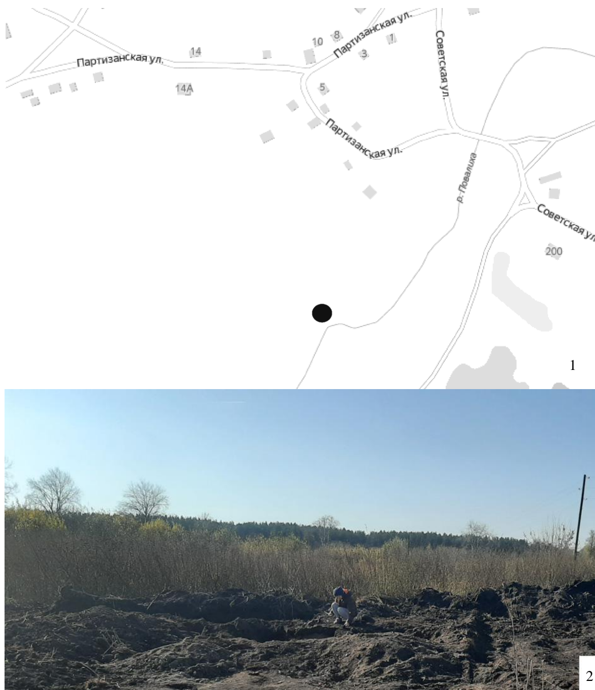
Рис. 2. Карта расположения (1) и фотофиксация (2) места, где были обнаружены археологические артефакты (ул. Партизанская, с. Повалиха).

(рис. 6, 1–10) и Павла I (рис. 6, 11–14). Картирование аналогичных находок на территории других старых сел Алтайского края – задача будущих исследований.