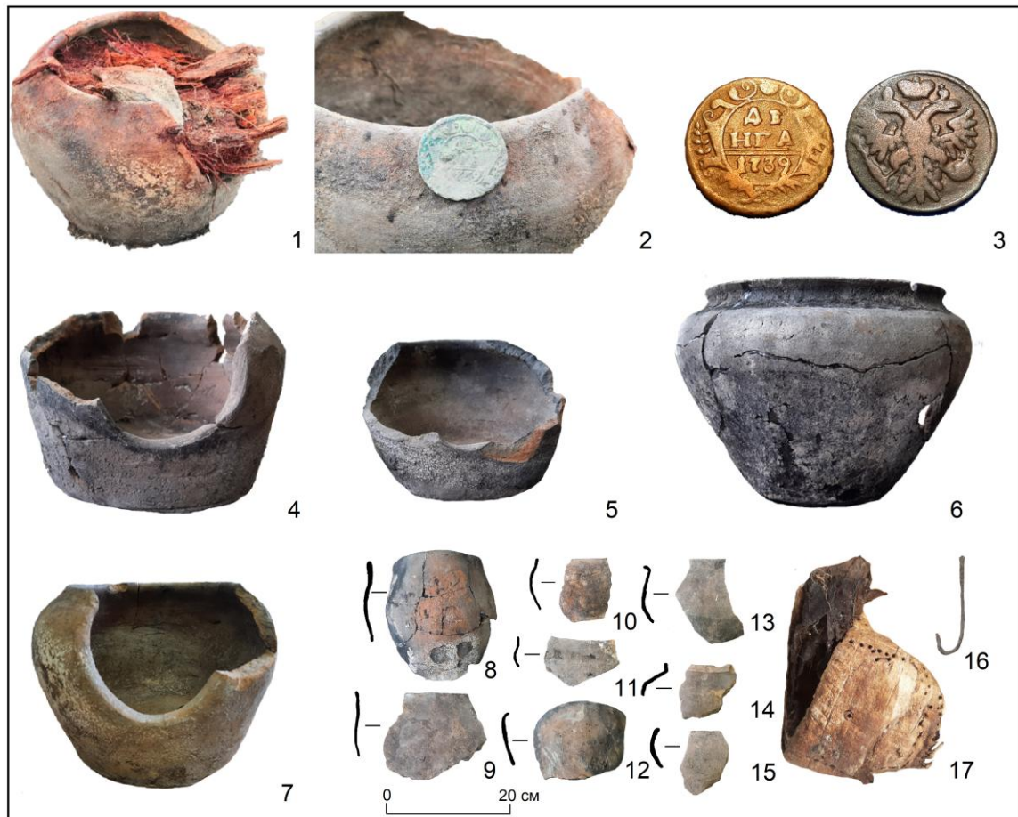
Рис. 3. Керамический комплекс с улицы Партизанской (1–7, 16, 17 – без масштаба):

1 – сосуд № 4 с древесным заполнением на момент обнаружения; 2 – сосуд № 4 и монета после извлечения древесного заполнения; 3 – монета после очистки; 4 – сосуд № 1; 5 – сосуд № 2; 6 – сосуд № 3; 7 – сосуд № 4; 8–15 – отдельные фрагменты венчиков сосудов; 16 – рыболовный крючок; 17 – берестяной фрагмент обуви. 1, 2 – фото В. А. Махотина; 3, 8–15 – фото К. А. Назарова; 4–7, 16, 17 – фото Н. Н. Головченко