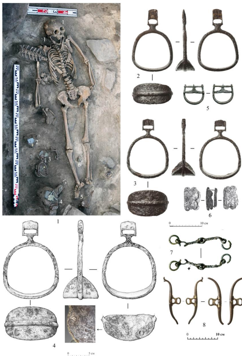
Рис. 1. Могильник Саяны-Пограничное-4. Курган 4, погребение 1, погребальный инвентарь: 1 – расположение сопроводительного инвентаря; 2, 3 – железные стремена; 4 – стремя с прорисовкой декора; 5 – подпружная железная пряжка; 6 – ремонтное крепление седла; 7 – железные удила с бронзовыми позолоченными кольцами; 8 – бронзовые позолоченные псалии после реставрации

подножки. При этом если форма стремени характерна для тюркских древностей, то орнамент является образцом китайского декоративного искусства, испытавшего влияние индийского и иранского художественных стилей. Небольшие по площади изображения на внутренней части подножки и части дужки со сложной, композиционно насыщенной орнаментацией (рис. 1, 3, 4). На наш взгляд, орнаментация саяно-пограничного стремени выполнена в стилистике «барокко периода позднего Тан».