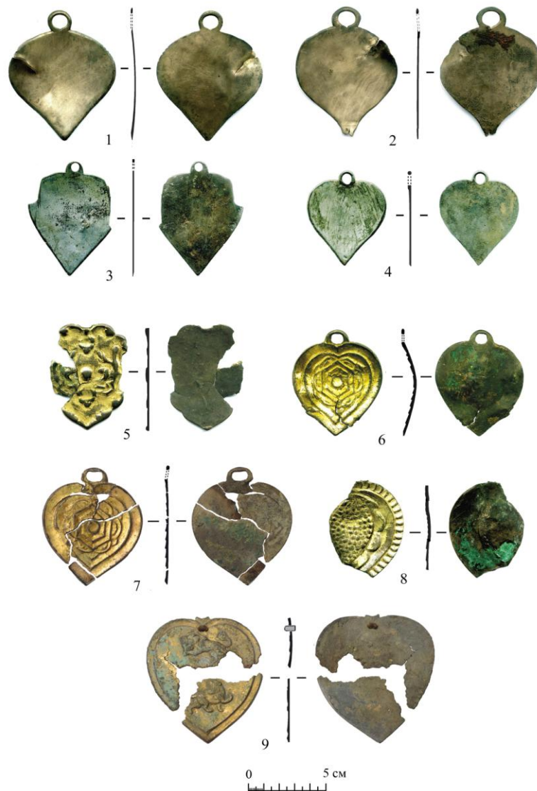
Рис. 4. Могильник Саяны-Пограничное-4. Курган 4, погребение 1, украшения сбруи: 1–4 – бронзовые луженые подвески; 5–9 – бронзовые позолоченные орнаментированные подвески

Гладкие бляхи (4 экз.) плоские, луженые, с округлой петлей для подвешивания, по краям разрывы (рис. 4, 1–4). В Минусинской котловине наиболее представительная серия из семи гладких блях обнаружена в кыргызском кургане 1 могильника Капчалы I [Левашова, 1952, с. 128, рис. 1, 28, 29]. Другой крупный набор (19 экз.) «кресаловидных» и «сердцевидных» блях происходит из Кузнецкой котловины. Они обнаружены в погребениях с кремациями и в жертвенных комплексах некрополя IX в. н. э. Ваганово I (курганы № 2, 5 и 7) [Бобров и др., 2010, с. 45, рис. 31, 18, 36, 37, 40, 42, 37, 5, 52, 1–5, 30–38]. Дополняют эту коллекцию находки пяти массивных бронзовых блях из могильника Сапогово (курганы № 13, 16 и 19) [Илюшин и др., 1992, с. 24, рис. 35, 17, 42, 13, 49, 13, 14, 51, 32].