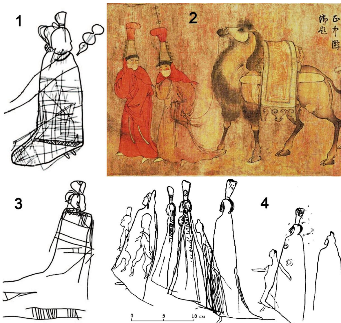
Рис. 2. Фигуры в длиннополых одеждах и картина «Кочевники»:

1, 3 – рисунки на плитах курганов близ улуса Подкамень; 2 – фрагмент картины «Кочевники»; 4 – Чульская писаница (1, 3 – по: [Панкова, 2013, с. 142, рис. 32, 1, 2]; 2 – по: [Варенов, Пан, 2022, с. 24, рис. 1, 1]; 4 – по: [Рыбаков, 2011, с. 100, рис. 1])