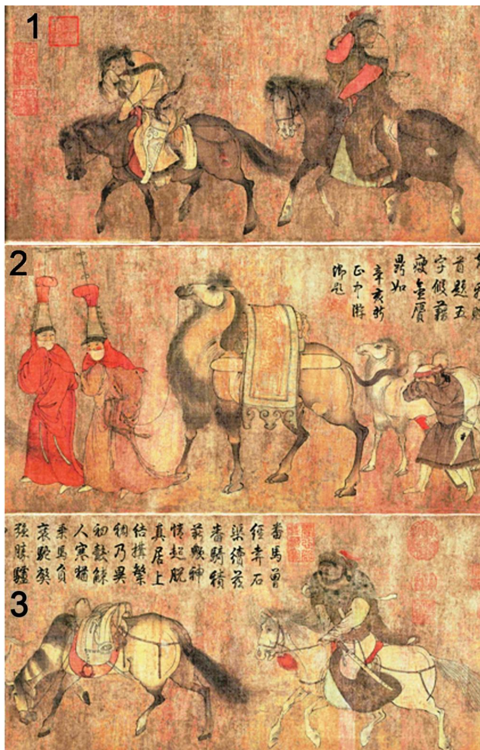
Рис. 3. Картина «Кочевники» («Фаньци ту»): 1 – фрагмент (левая часть); 2 – фрагмент (центр); 3 – фрагмент (правая часть) По: [Чжунго мэйшу..., 1984, с. 109, рис. 56]