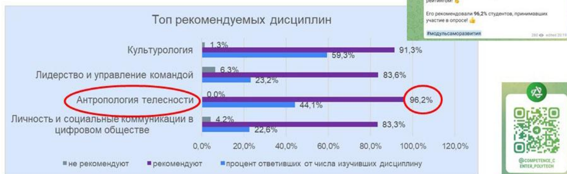
Рис. 3. Анкетирование по итогам освоения дисциплины в рамках Модуля саморазвития (Soft Skills), осень 2022 г. (данные Центра компетенций СПбПУ Петра Великого)