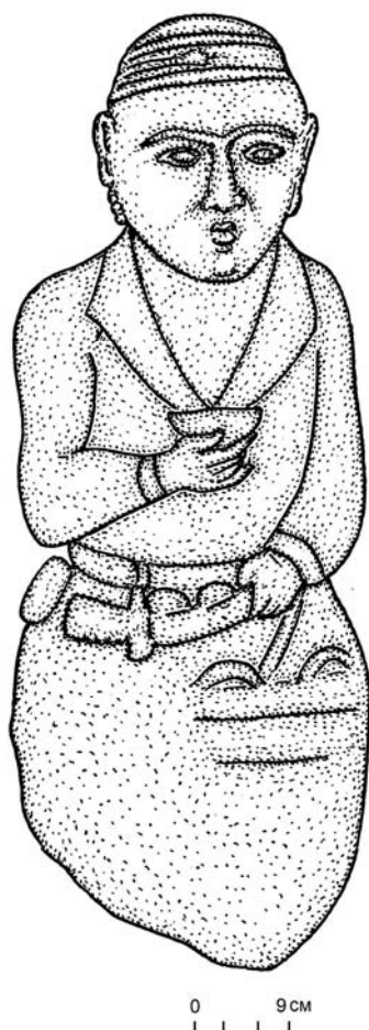
Рис. 2. Каменное изваяние древнего тюрка из музея им. В. А. Лапко

Другое своеобразное антропоморфное каменное изваяние находится в экспозиции внутри помещения музея. Его высота 96 см, ширина 38 см, толщина 40 см (рис. 2). Представляет собой объемную скульптуру, выполненную из массивного каменного монолита. Ее голова была некогда отбита и, вероятно, после обнаружения приклеена на прежнее место, к сожалению, не очень аккуратно (на поверхности лицевой части скульптуры сохранились потеки клея). На голове изваяния низким барельефом воспроизведен сферический головной убор с широким окольшем, окаймленным вдоль верхнего и нижнего краев узкими горизонтальными полосами. Между ними выделяется еще одна, третья полоса, оканчивающаяся посередине небольшим расширением асимметрично-ромбической формы. Изображенное лицо довольно молоджавое, без усов и бороды. Брови дуговидные, плавно