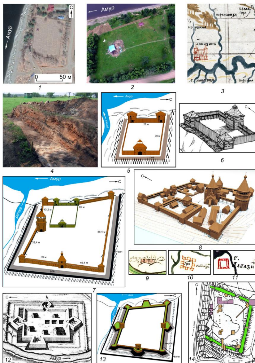
Рис. 1. Албазинский острог:

1, 2 – современный вид археологического памятника; 3 – фрагмент карты из «Хорографической чертежной книги» С. У. Ремезова; 4 – разрез восточного вала (фото С. П. Нестерова, 2012 г.); 5, 6 – варианты реконструкции острога Черниговского; 7 – вариант реконструкции острога 1682–1685 гг.; 8 – компьютерная 3D-модель крепости; 9–11 – рисунки острога второй половины 1680-х гг. на картах: из «Чертежа реки Амур 1699 года» (9), по данным А. Бейтона (10), из «Служебной чертежной книги» С. У. Ремезова (11); 12 – рисунок Н. Витсена; 13 – реконструкция острога второй половины 1680-х гг.; 14 – план раскопанных участков на территории острога. Масштаб различный (1 – по: Google Earth Pro; 2 – социальные сети, автор неизвестен; 3, 5, 7, 9–13 – по: [Трухин, Багрин, 2019]; 6, 14 – по: [Артемьев, 1999]; 8 – по: [Еремин и др., 2021])