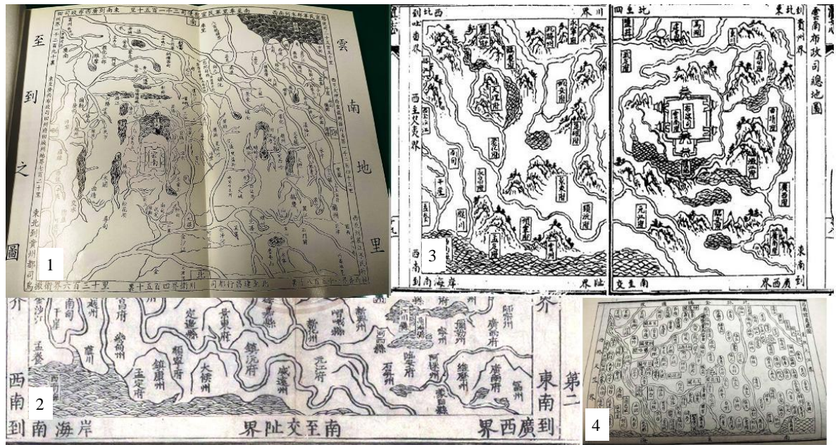
Рис. 1. Минские карты Юньнани:

1 – карта провинции Юньнань из «Описания Юньнани годов Цзинтай с картинами» (ок. 1454); 2 – фрагмент карты провинции Юньнань из «Описания Юньнани годов Ваньли» (1572); 3 – карта департамента по гражданским и финансовым делам Юньнани из «Описания Дянь годов Тяньци» (цз. 1, ок. 1617), 4 – «Общая карта всех варваров-и юго-запада» из «Описания Дянь годов Тяньци» (ок. 1617). По: 1 – [Ли Чуньлун, Лю Цзинмао, 2002, с. i]; 2 – [Ваньли юньнань тунчжи]; 3 – [Тяньци дяньчжи]; 4 – [Лю Вэньчжэн, Гу Юнцзи, 1991, с. XX]