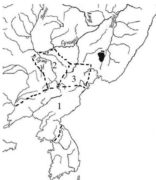
Рис. 1. Территории, ориентировочно занимаемые государствами Когурё (1), Фуую (2) и Восточное Фуую (3) в начале V в. н. э.

Основными источниками по локализации мохэских племен являются «Вэй шу», «Бэй ши» и «Суй шу». Первая из этих летописей составлена в VI в. Содержащиеся в ней сведения об уцзи почти целиком были перенесены в «Бэй ши» [Полутов, 2016, с. 181] и, видимо, в «Суй шу», которые были составлены примерно в одно время (середина VII в.). Определенная информация о мохэ содержится в «Цзю тан шу» и в его исправленном варианте «Синь тан шу». Но в этой хронике имеются сведения из «не дошедших до нас источников», при этом касающихся не только мохэ . Вполне возможно, что наличие в ней недостоверной информации и стало причиной того, что сунский император Жэнь-цзун, недовольный содержанием «Цзю тан шу», приказал в середине XI в. составить «Новую историю Тан», которую все равно сделали на основе старой. Поэтому брать информацию из танских хроник следует с большой осторожностью.