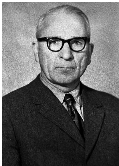
Рис. 1. Константин Афанасьевич Железняков (1914, Николаевск-на-Амуре – 1987, Иркутск)

Именно в одном из первых номеров «Записок...» этого общества, ставших в наши дни редким изданием, и была опубликована статья К. А. Железнякова о его обследованиях низовьев р. Ашихэ восточнее Харбина в 1937–1943 гг. [Железняков, 1946]. Несмотря на то, что он сам называл свой интерес к археологии любительским, вклад тогда еще молодого исследователя в изучение археологии мохэ трудно переоценить.