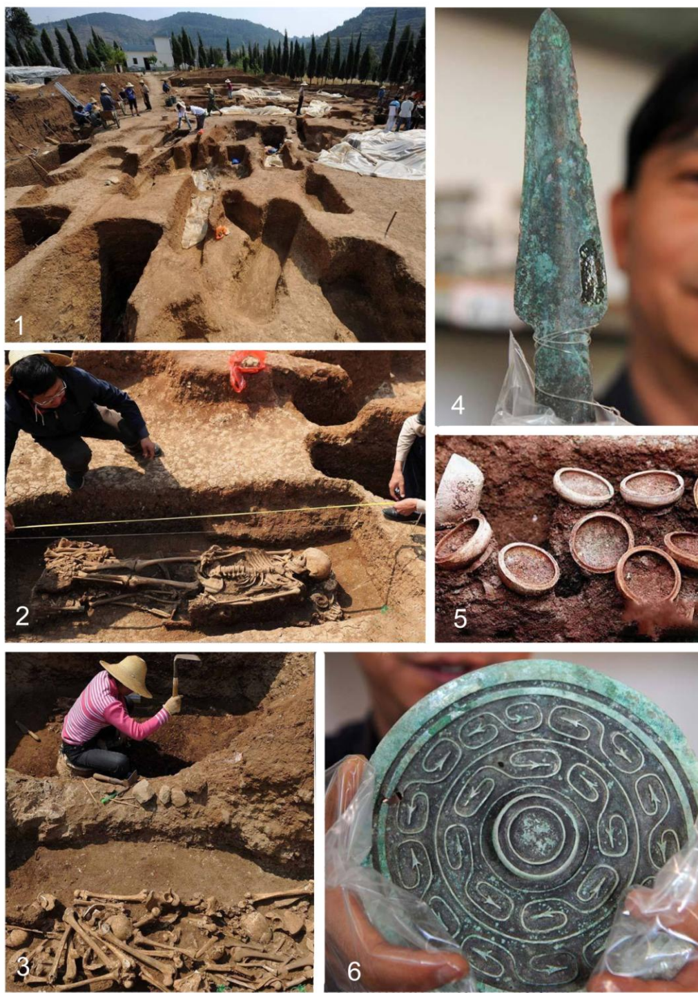
Рис. 1. Моменты раскопок могильника Цзиньляньшань в 2009 г.:

1 – общий вид раскопа; 2 – могила, сочетающая первичное и вторичное погребения; 3 – выкладка из костей; 4 – находка бронзового наконечника копья; 5 – скопление целых керамических сосудов (пиалы вань ); 6 – находка бронзовой бляхи.