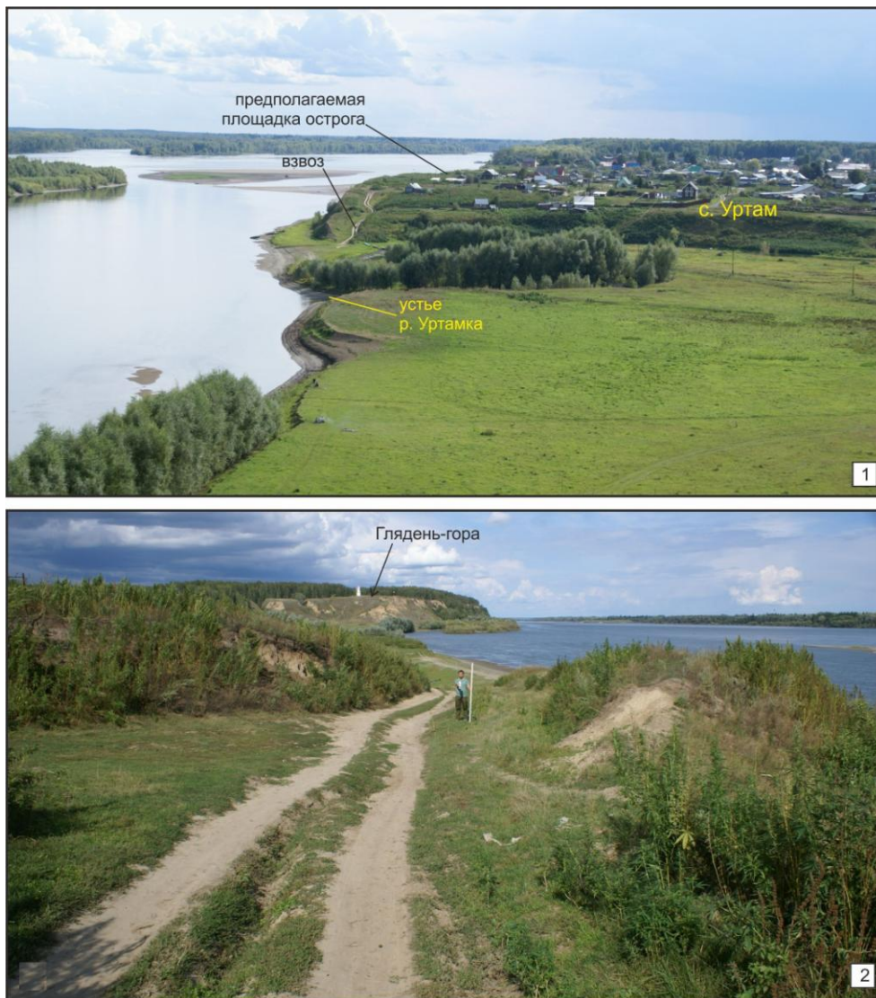
Рис. 2. Места предполагаемого расположения Уртамского острога:

вую очередь ассоциируется с понятиями «глядеть», «наблюдать». Холмы Уртамского яра почти в два с половиной раза выше «мыса» («стрелки») на правом берегу Уртамки), и с его вершины, действительно, открывается обзор на большие расстояния в трех направлениях – на юг, юго-восток и юго-запад, т. е. туда, откуда в XVII – середине XVIII в. могла угрожать военная опасность. В соответствии с таким рельефом местности острог, вероятнее всего, должен быть построен именно на «мысу» («стрелке») правого берега Уртамки, при ее впадении в Обь. Этот уплощенный участок восточной (приречной) части террасы высотой около 21 м от уровня воды в Оби плавно понижается в сторону Уртамки (рис. 2, 1). Указанная высота берега вполне достаточна для исключения его затоплений в ходе сезонных наводнений.