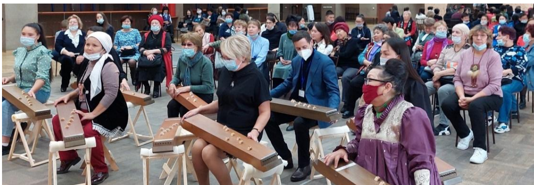
Рис. 3 (фото). Участники мероприятия в творческой лаборатории по игре на хакасских музыкальных инструментах