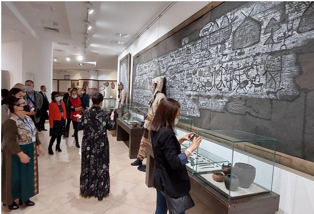
Рис. 2 (фото). Участники мероприятия в Хакасском национальном краеведческом музее им. Л. Р. Кызласова