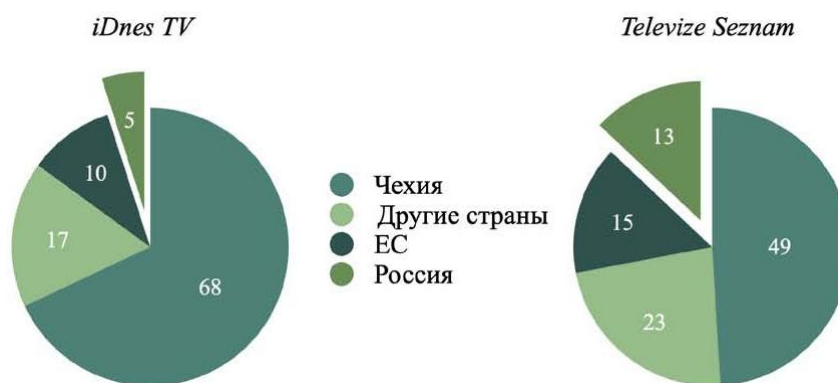
Рис. 1. Средние показатели масштаба событий по I и II периодам исследования (% от числа проанализированных материалов по двум периодам) Fig 1. The average scale of the I and II study periods (%)

Больше всего материалов о российско-чешских отношениях вышло в I и II периоды исследования (рис. 1). Так, Televize Seznam чаще освещал данную тематику (в 13 % сюжетов фигурировала Россия), чем iDnes TV (5 %). Также отметим, что iDnes TV в целом больше, чем Televize Seznam , интересовали внутренние новости. iDnes TV посвятил внутрочешским событиям почти на пятую часть больше материалов, чем Televize Seznam : 68 % сюжетов у iDnes TV и 49 % у Televize Seznam .