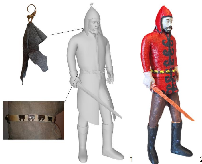
Рис. 3. Создание 3D-модели воина Верхнеобского бассейна эпохи раннего железа: 1 – первичная модель и прототипы для нее; 2 – модель после печати на 3D-принтере и раскраски.