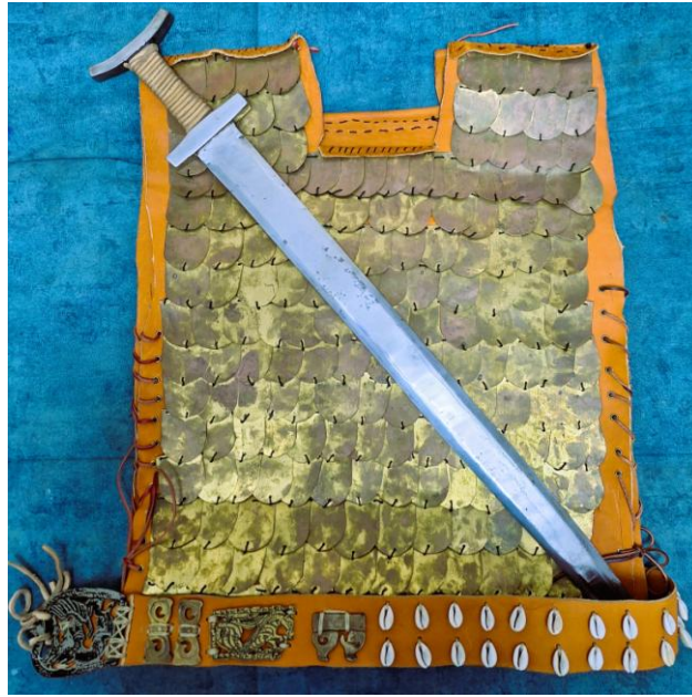
Рис. 2. Стилизация меча, доспеха и пояса второй половины I тыс. до н. э.