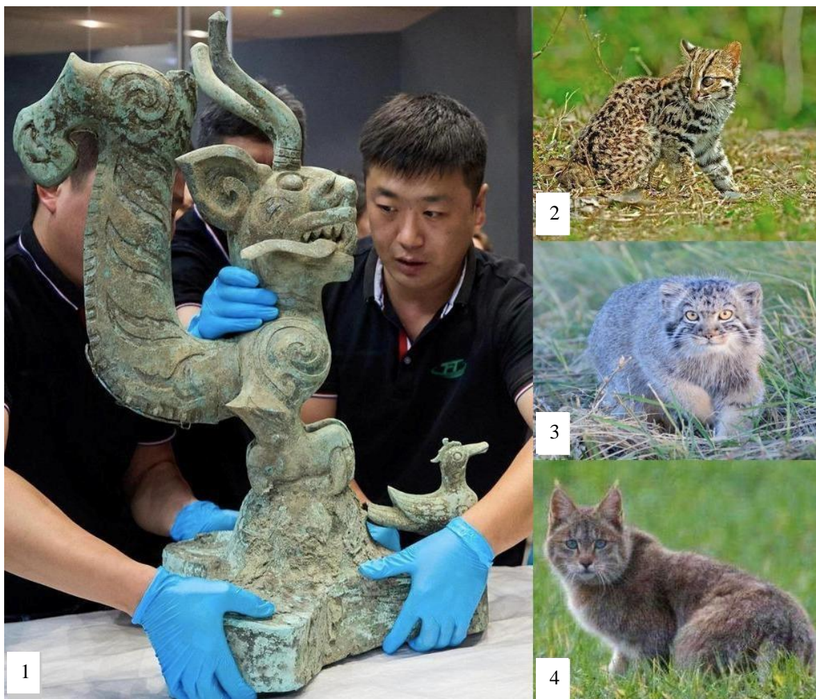
Рис. 5. Бронзовая статуэтка кошки из JK8 и дикие кошки пров. Сычуань:

1 – монтаж статуэтки кошки на выставке в Сянгане (Гонконге); 2 – леопардовая (бенгальская) кошка; 3 – манул (Палласов кот); 4 – китайская горная кошка. По: 1 – [Xu, 2023]; 2–4 – Википедия