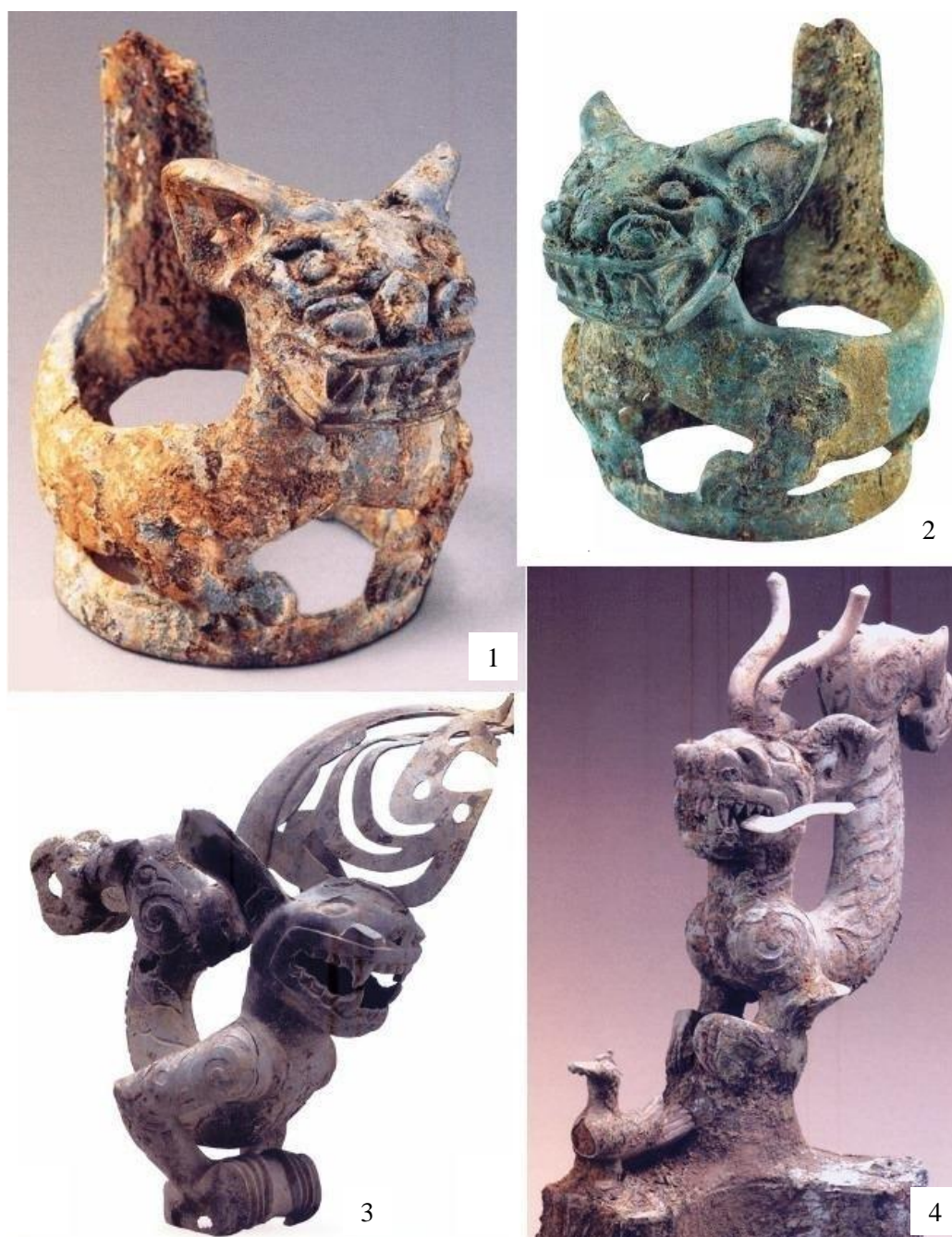
Рис. 4. Бронзовые статуэтки кошек из Саньсиндуя:

В 2020 г. археологические исследования на памятнике Саньсиндуй, приостановленные еще в 1986 г., возобновились. Были обнаружены шесть новых жертвенных ям, получивших индексы от JK3 до JK8, полные научные результаты исследования которых не опубликованы