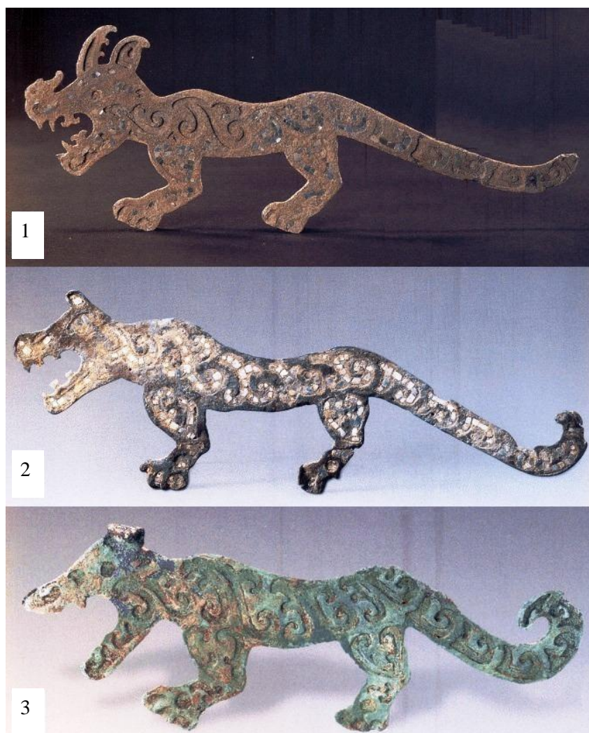
Рис. 1. Бронзовые пластины в виде тигров или леопардов:

1 – находка 1984 г.; 2 – находка 1995 г.; 3 – находка 2001 г. По: 1 – [Чжунго тунци цюаньцзи, 1994, с. 58, рис. 66]; 2 – [Саньсиндуй юй Наньсылу..., 2007, с. 26, рис. 18]; 3 – [Саньсиндуй юй Цзиньша..., 2010, с. 69]