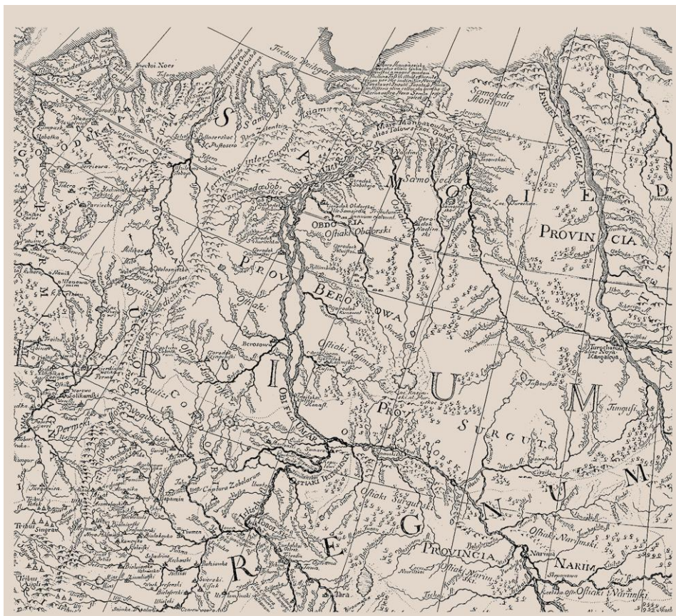
Рис. 11. Карта Ф. И. Страленберга (фрагмент). 1730 г. Fig. 11. Map by P. J. Strahlenberg (fragment). 1730

Если судить по историческим источникам, новгородская Югра упоминалась в Приуралье, московская – в Зауралье. Означает ли это пространственное перемещение Югры, или правильнее вести речь о смене власти и, соответственно, взгляда? Известно, что новая власть склонна к переименованию городов, улиц, народов [Головнёв, 2021, с. 210], и Югра могла стать заложницей московско-новгородских противоречий. Правильнее всего учитывать оба фактора: и различие в отношении Новгорода и Москвы к зависимым народам, и обновление новой властью прежних названий.