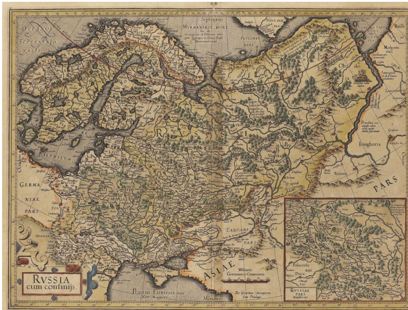
Рис. 10. Герард Меркатор. Руссия. 1594 г. Fig. 10. G. Mercator. Russia. 1594