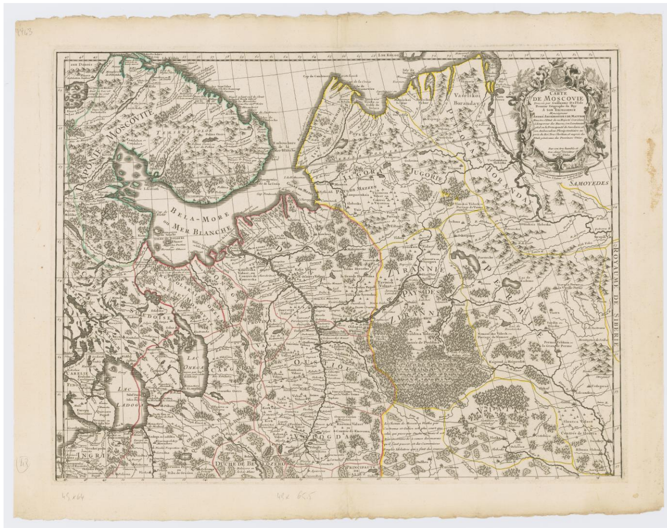
Рис. 6. Г. де Лиль. Карта Московии. 1706 г. Fig. 6. G. Delisle. Map of Moscovia. 1706