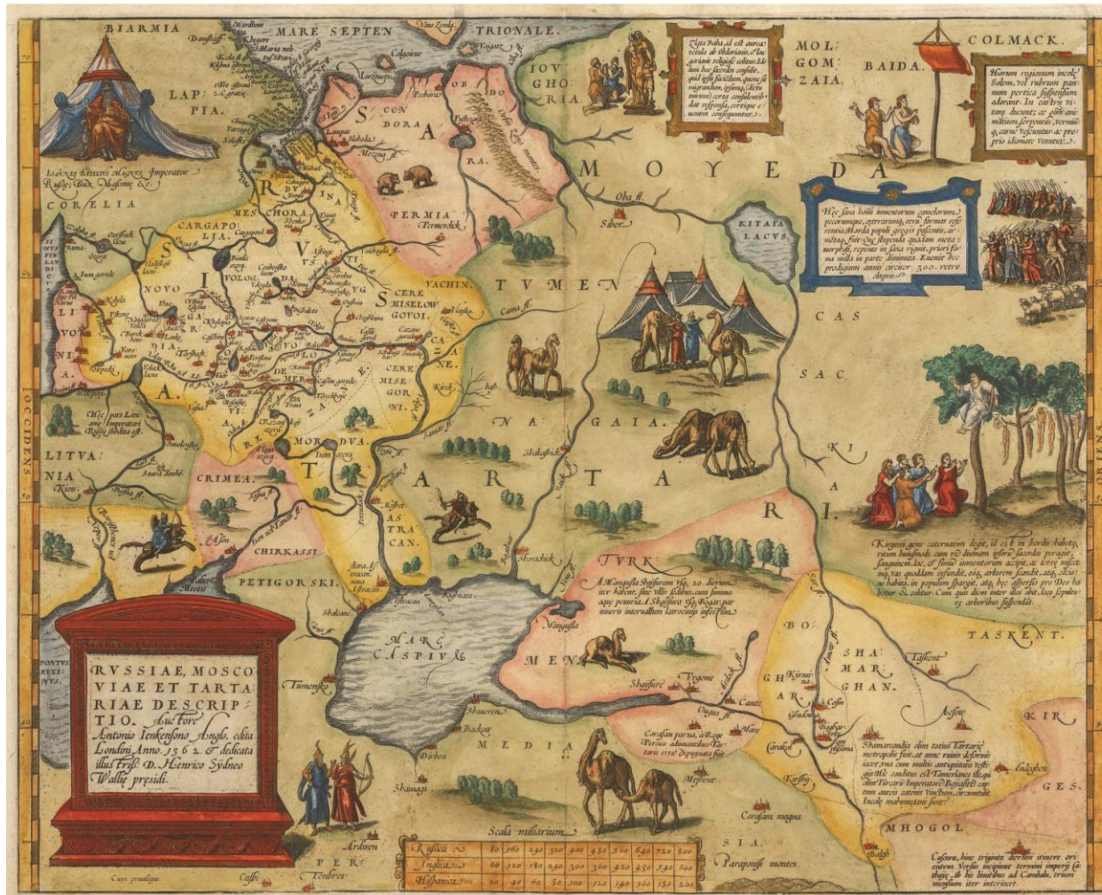
Рис. 9. Э. Дженкинсон. Russiae, Moscoviae Tartariae Description. 1562 г. Fig. 9. A. Jankinsson. Russiae, Moscoviae Tartariae Description. 1562