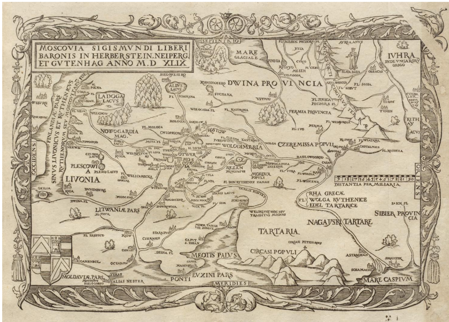
Рис. 8. С. Герберштейн. Moscovia. 1549 г. Fig. 8. S. Herberstein. Rerum Moscoviticarum Commentarii. 1549