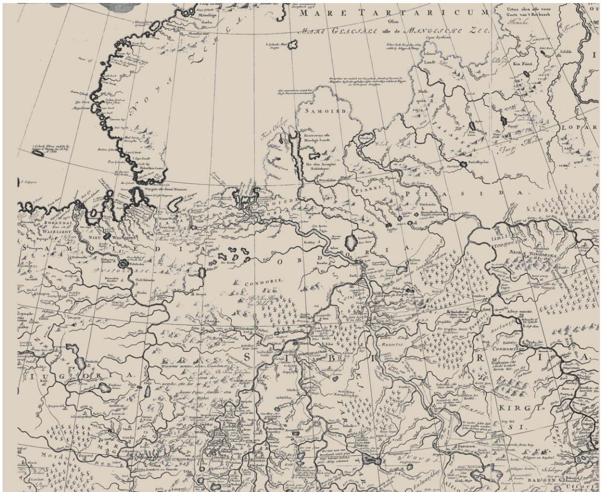
Рис. 5. Н. Витсен. Северная и Восточная Тартария (фрагмент). 1692 г.

Самым заметным успехом московского продвижения к Уралу стало крещение пермян в 1379–1383 гг. уроженцем Устюга и ставленником Москвы Стефаном Пермским. В 1383 г. была учреждена новая Пермская епархия, епископом которой стал Стефан, а на следующий год кудесник Пам, предводитель отвергших крещение язычников, увел значительную часть соплеменников за Урал на Обь [Головнёв, 2010]. Судя по всему, в поток переселенцев из Перми влились жители соседних областей Приуралья, в том числе Югры. Поскольку Югра и раньше располагалась по обе стороны Югорского камня, эти миграции были, по существу, внутренним перетоком югричей, но при этом на западе их число убывало, а на востоке нарастало. Кроме того, за Урал перешли строптивые югорские вожди, и отныне для мирного или немирного урегулирования отношений с Югрой следовало обращаться за Камень.