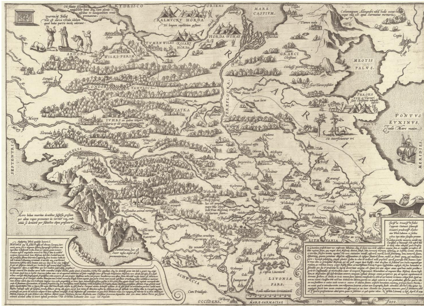
Рис. 3. А. Вид. Тартария. 1555 г. Fig. 3. A. Wied. Taryaria. 1555