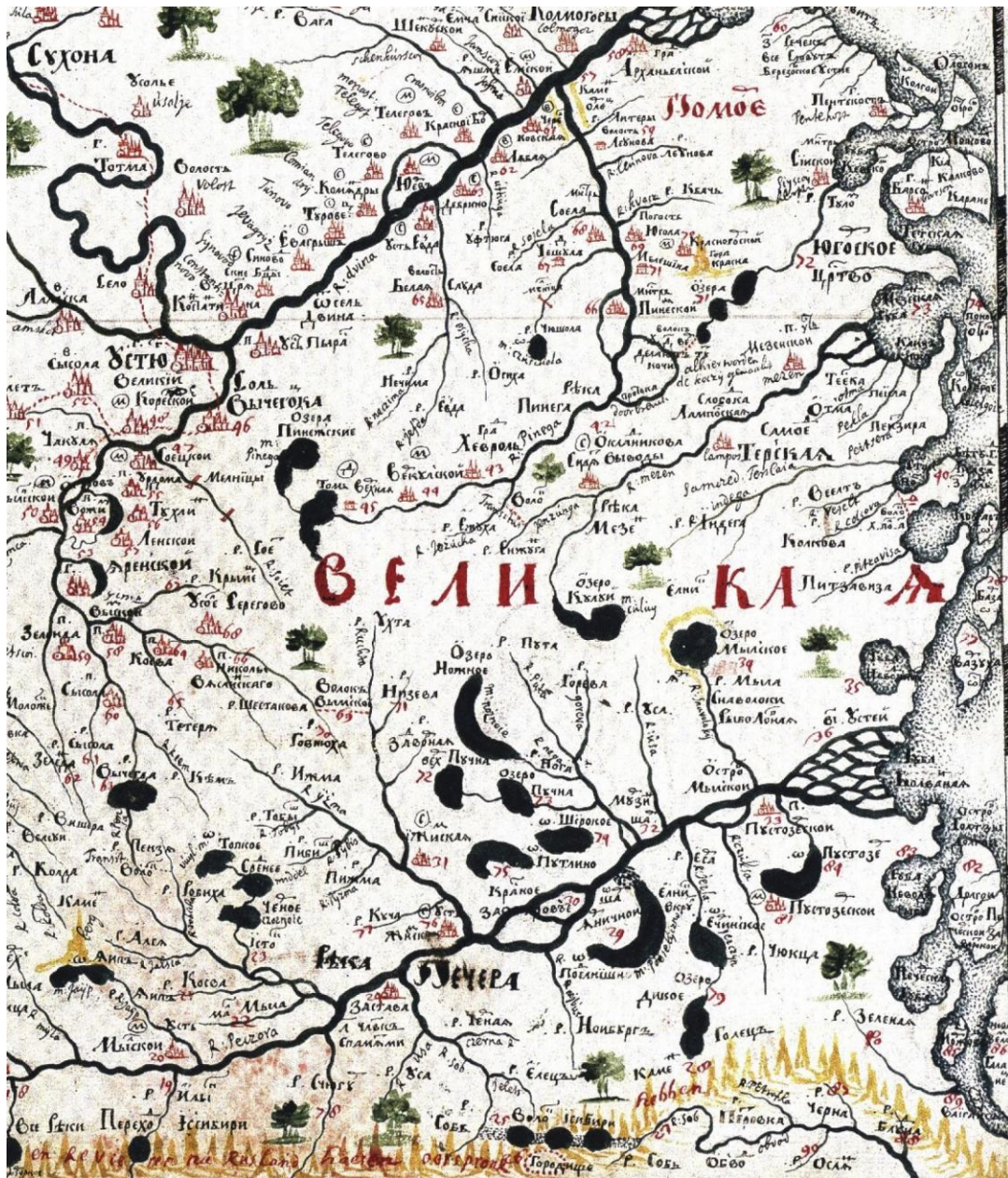
Рис. 7. С. У. Ремезов. Чертежная книга Сибири (фрагмент). 1701 г.